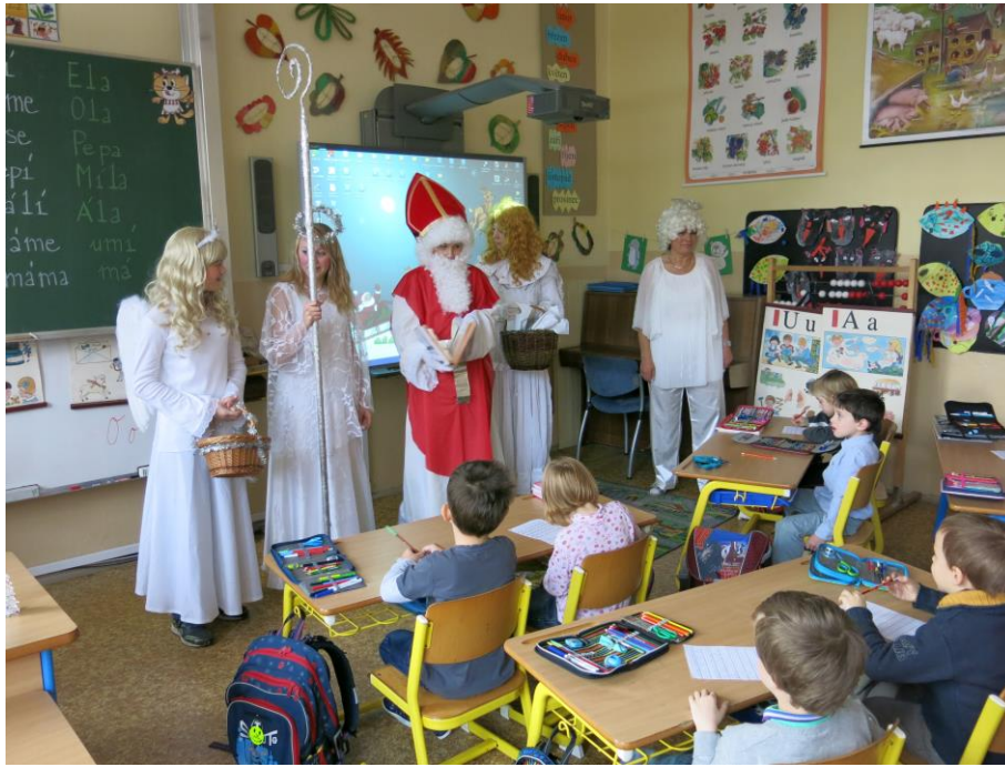
Mikuláš pro žáky I. stupně