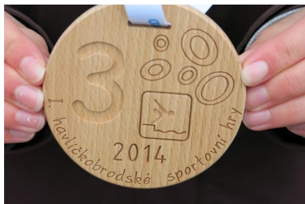
I. Havlíčkobrodské sportovní hry dětí a mládeže