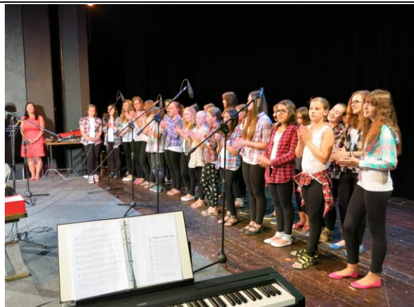
Z koncertů pěveckého sboru Oříšek