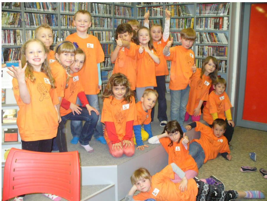
Noc s Andersenem

Za čistou řeku Sázavu Den evropských zahrad Pojďte s námi do školy Od louče k žárovce Od dírkové komory k fotoaparátu Alternativní zdroje energie Věda a technika včera a dnes Den zdraví – klíšťata Moje oblíbené zvíře – 6. B My Food My family My pet Healthy Lifestyles – 1. stupeň Halloween Den zvířátek – 5. A Our country Olympijské hry – 4. B Mikuláš Vánoční dílny Velikonoční dílny Pravěk – 4. A Jablíčkový den – 2. třídy Pohádkové vysvědčení – 2. třídy Bramborový den – 1. třídy