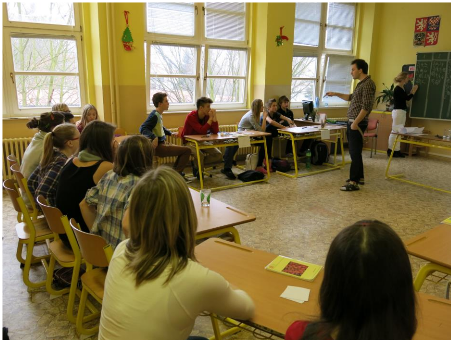
Předvánoční program pro žáky II. stupně