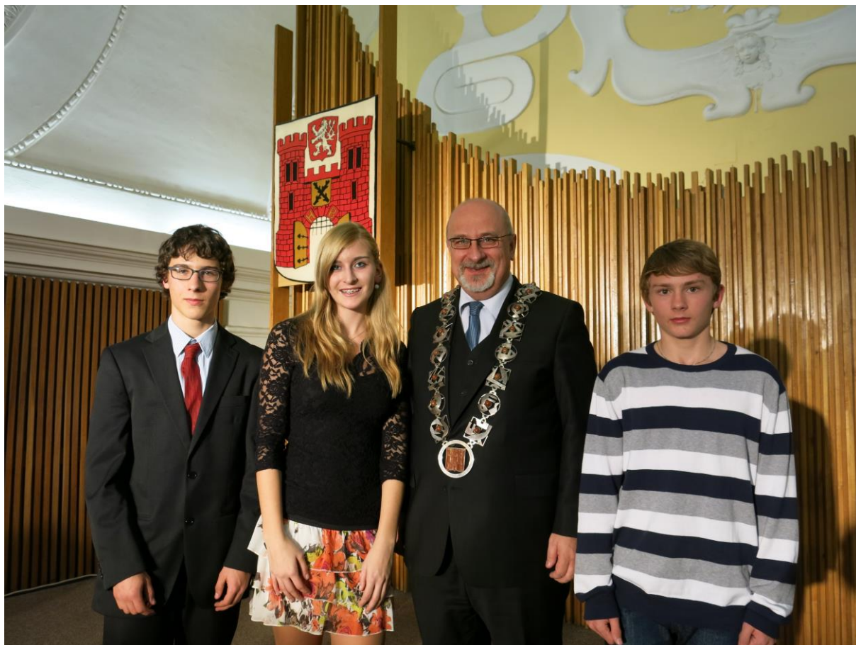
Ceny města Havlíčkův Brod 2013

Naši školu si o víkendech přišli prohlédnout bývalí absolventi.