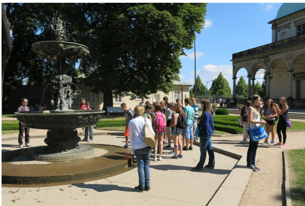
Ještě nekončíme – Praha 2014

Poznej svůj park – 4., 6., 7. ročník Ještě nekončíme – 9. ročník Můj dům, můj hrad – 8. ročník Poznej svůj počítač – 9. ročník Sněhuláci pro Afriku Současná hudební scéna – 5. ročník, 6. ročník