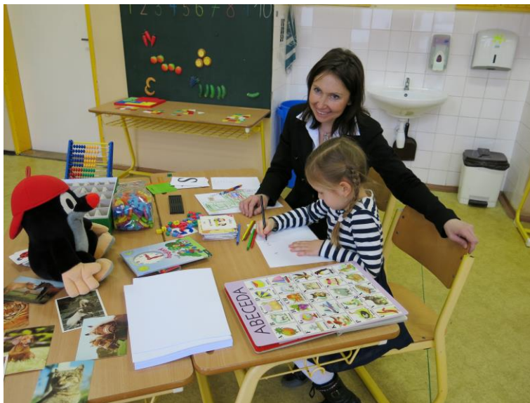
Zápis do 1. tříd