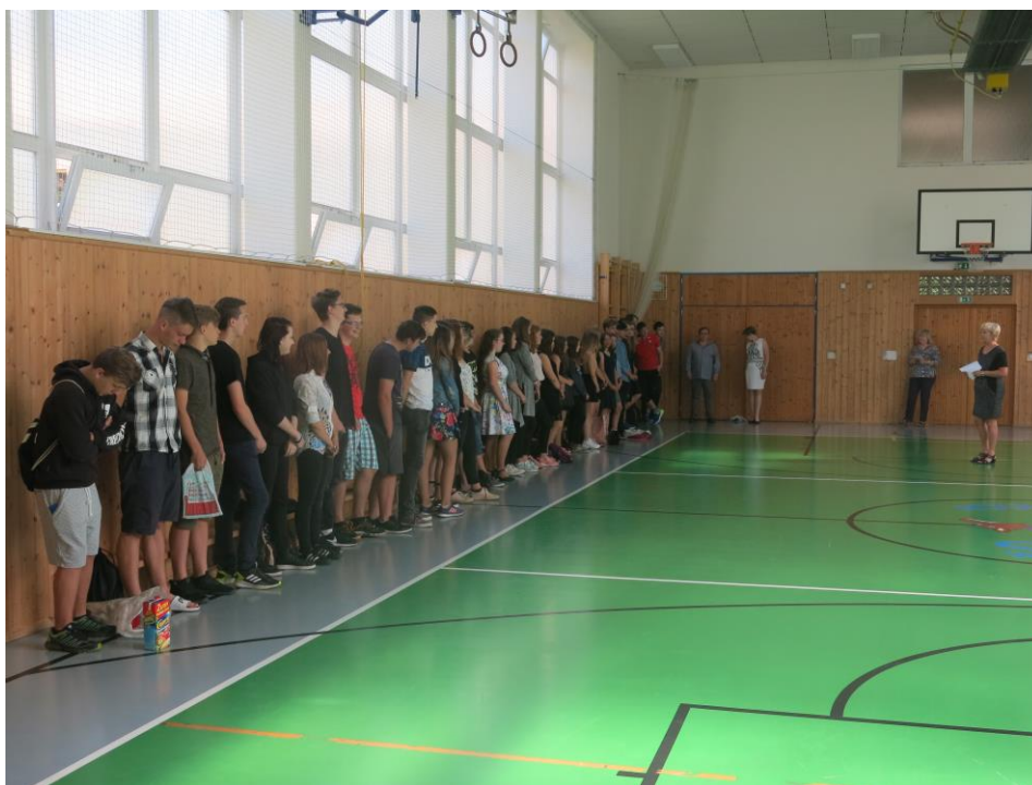
Motivační program žáků 9. ročníku – slavnostní vyhlášení výsledků

Součástí motivačního programu pro žáky 9. ročníku byl i závěrečný projekt Ještě nekončíme