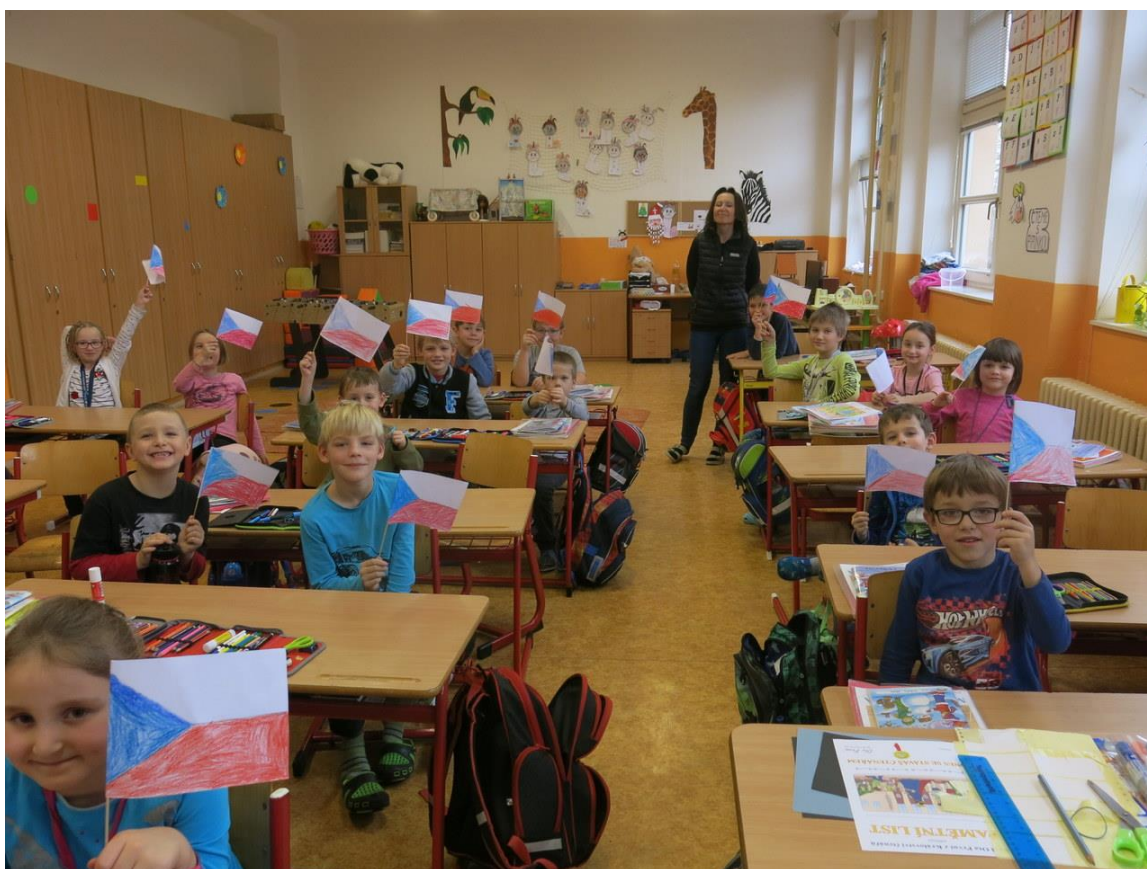
Úspěšný projekt „Česká republika 25“

Součástí projektu ČR 25 byla také zajímavá výtvarná soutěž, při níž žáci na I. stupni vytvářeli tematická díla "obohacená" o vzkazy České republiky.