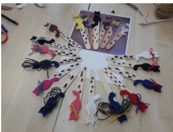
Spolupráce s Krajskou knihovnou Vysočiny – tvořivé dílny pro žáky 4. ročníku