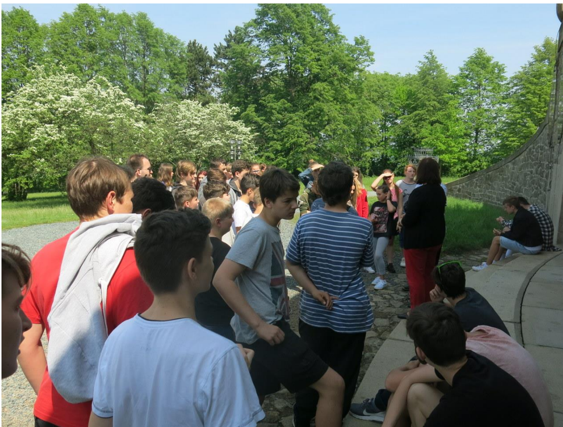
Po stopách bitvy tří císařů – Mohyla míru