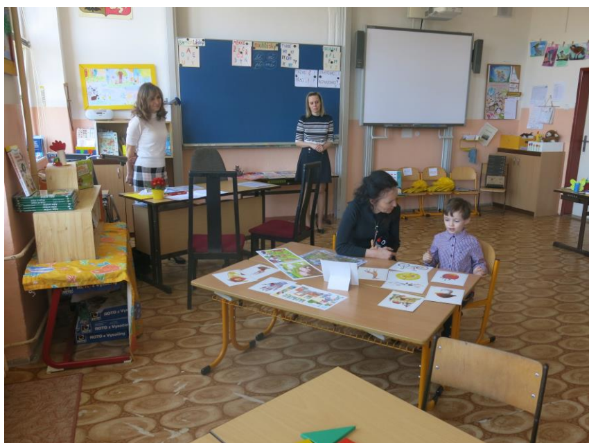
Zápis do 1. tříd