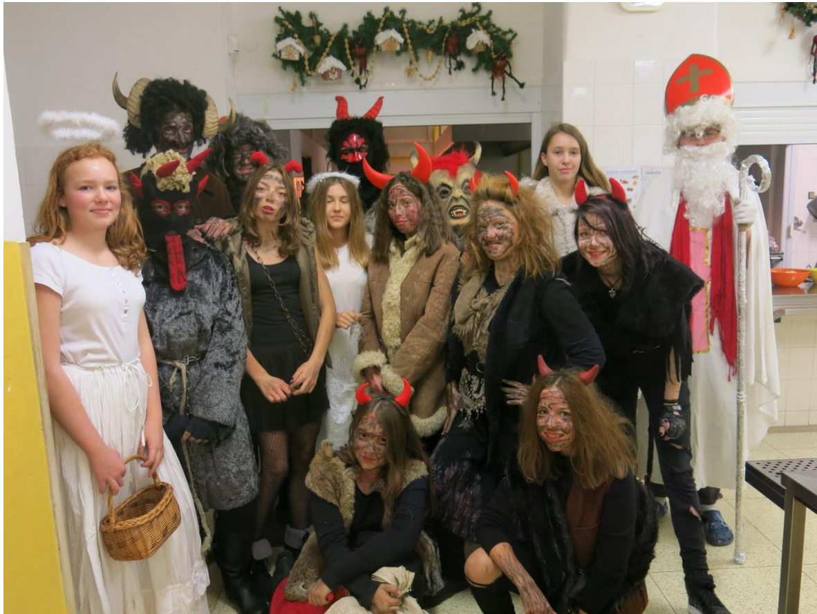
Mikuláš 2017 na ZŠ V Sadech