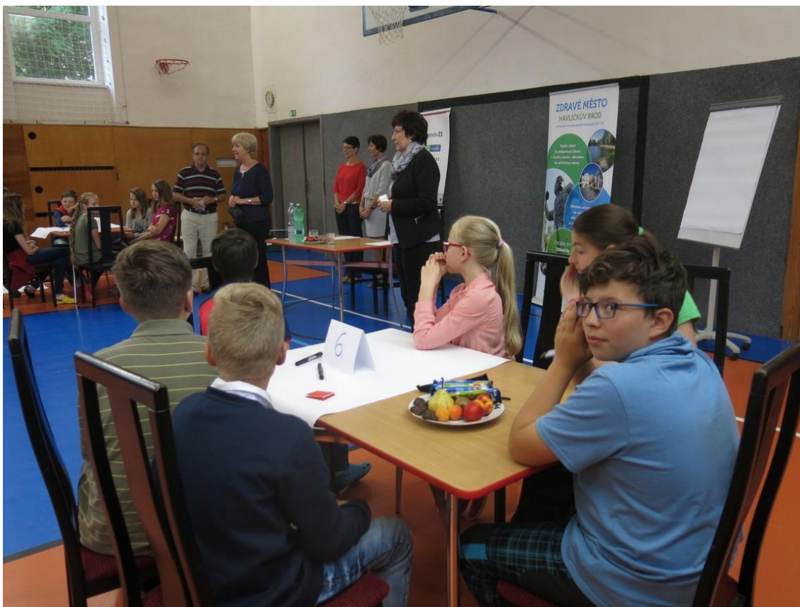
Školní fórum na ZŠ V Sadech

Výsledky školního fóra i ankety byly předány zřizovateli, který přislíbil pomoc při řešení.