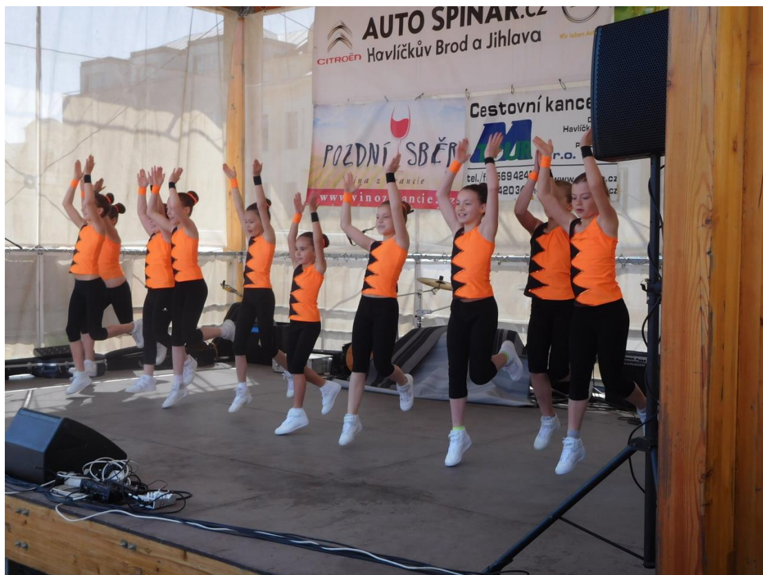
Aerobičky na Koudelově talíři