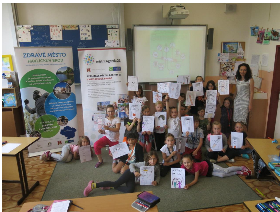
Den bez tabáku na ZŠ V Sadech