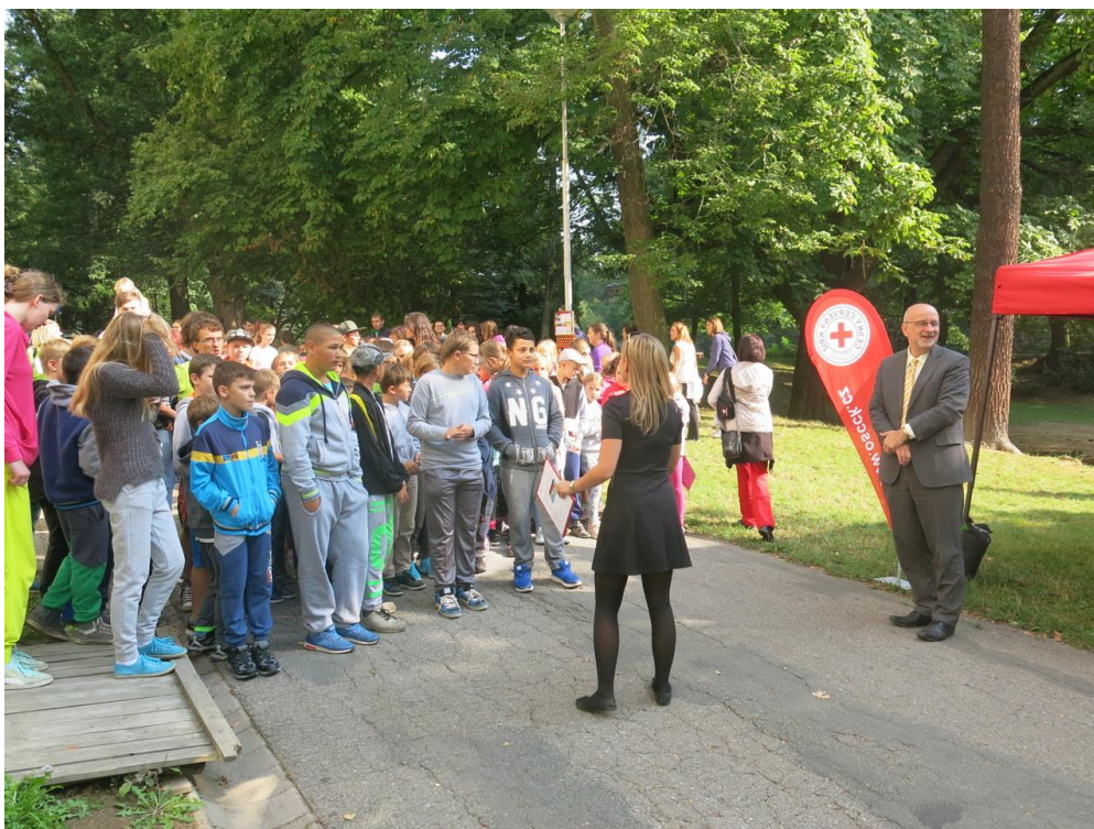
Běh naděje v parku Budoucnost

Řady účastníků významně rozšířili i žáci ze ZŠ V Sadech, když se do akce společně se svými učitelkami s chutí zapojily třídy 4. A, 4. C a 6. B.