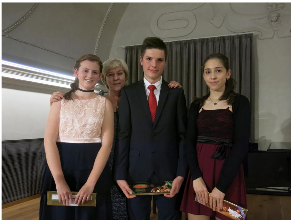
CENY MĚSTA HAVLÍČKŮV BROD 2017 – slavnostní večer v sále Staré radnice