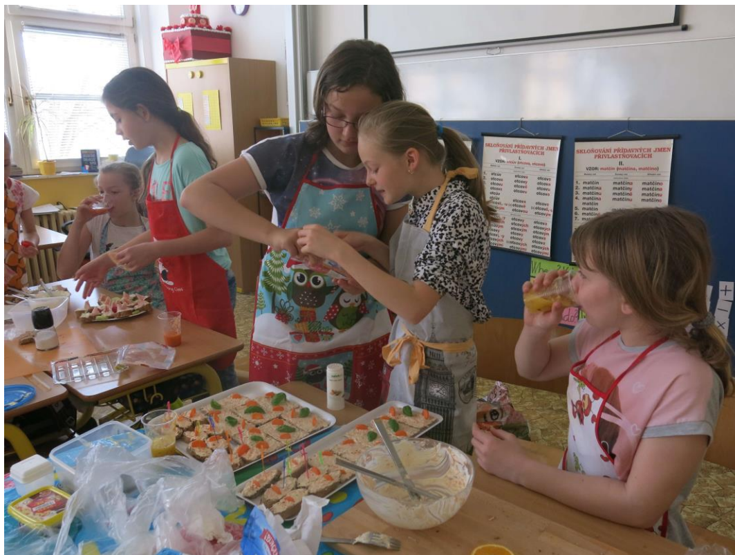
Světový den zdraví