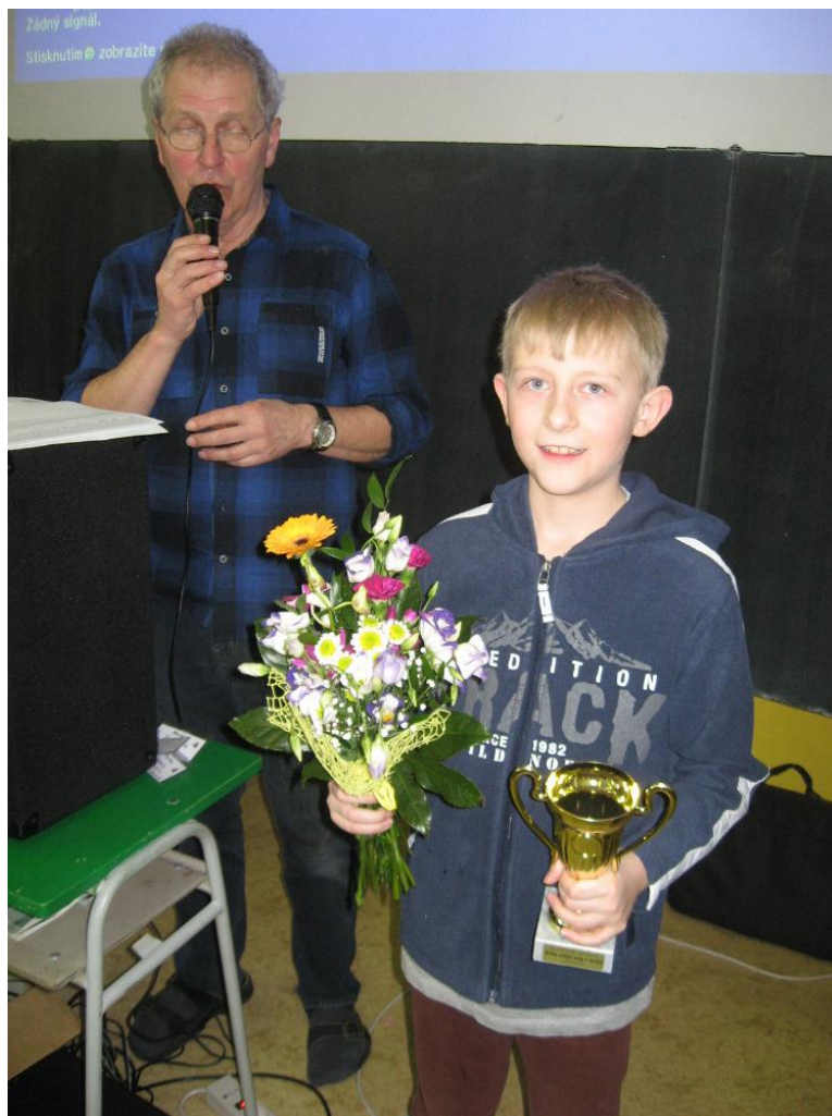
Šachista ze ZŠ V Sadech dal svým soupeřům mat

Pochválit je však nutné všechny malé hráče za bojovnost a ukázněnost. Pro některé z nich to byl vůbec první turnaj, při němž sbírali zejména zkušenosti, které se jim v budoucnu jistě neztratí.