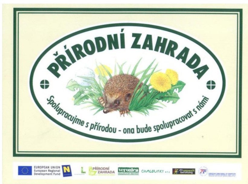
Školní zahrada při ZŠ V Sadech nese certifikát Přírodní zahrada

Naše školní zahrada má certifikát Přírodní zahrada - Spolupracujeme s přírodou - ona bude spolupracovat s námi.