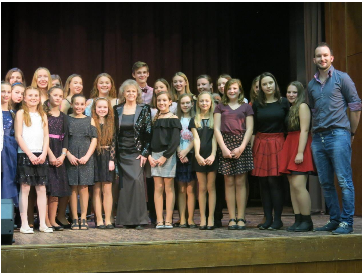
Z koncertů pěveckého sboru Oříšek