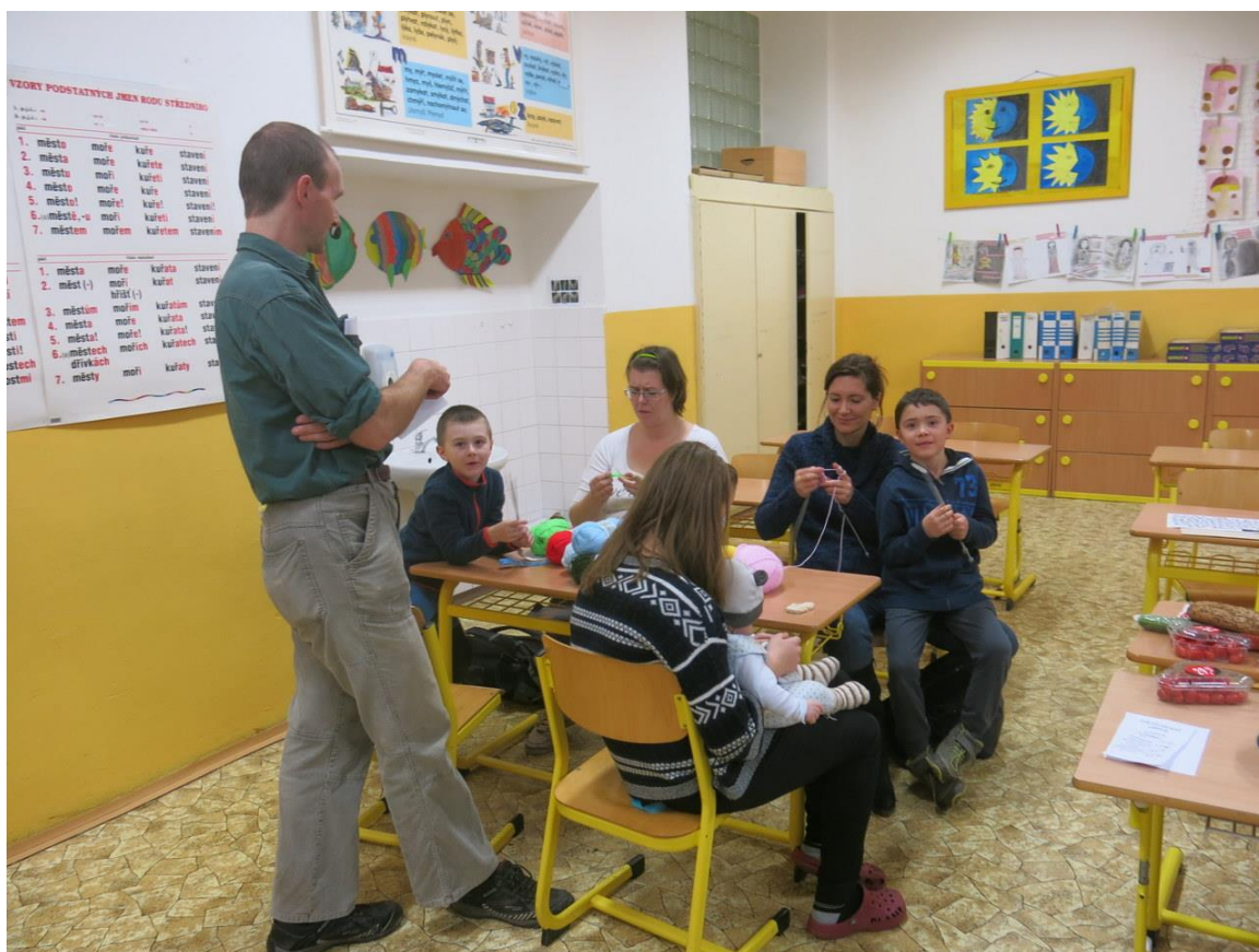
Projekt „Žijeme spolu aneb Napříč generacemi“ – tvořivé dílny pro rodiče a děti

V rámci mezigeneračního setkání proběhlo vystoupení stále populárnějšího pěveckého sboru Oříšek a soutěž tříčlenných rodinných týmů v několika disciplínách. Týmy se utkaly v pečení podzimního štrúdlu, tvoření zdravého talíře, poznávání stromů podle listů, správné recyklaci, vytváření tangramů, pohybových hrách, mezigeneračním vědomostním kvízu a dalších zábavných aktivitách.