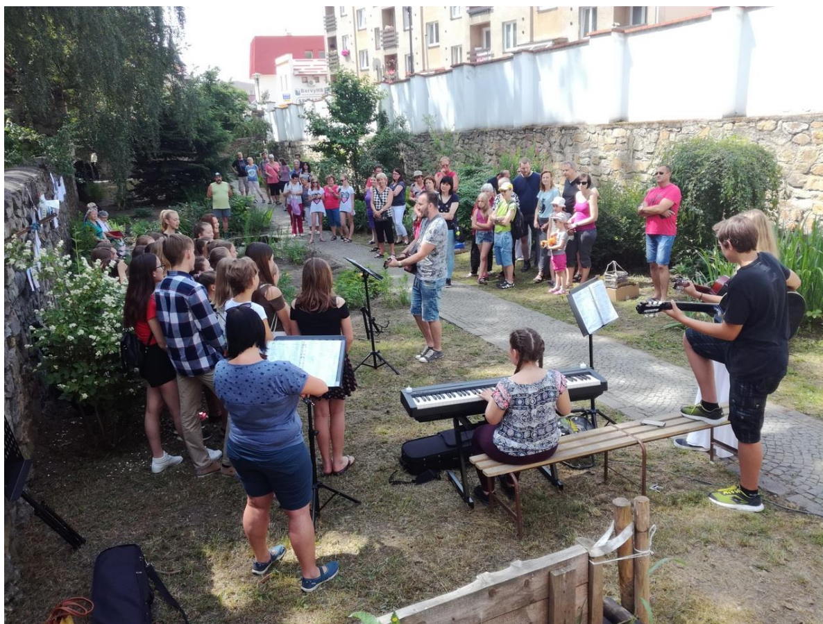
Víkend otevřených zahrad s Oříškem

Naše školní zahrada má certifikát Přírodní zahrada - Spolupracujeme s přírodou - ona bude spolupracovat s námi.