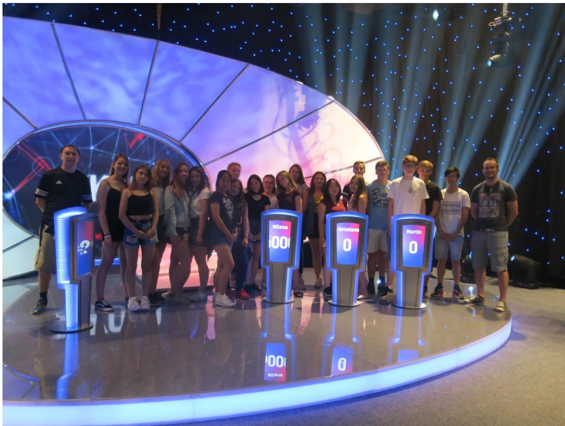
Projekt „Ještě nekončíme 2018“ – návštěva České televize

Pohyb je život – I. stupeň Podzim – I. stupeň Zima – I. stupeň Jaro – I. stupeň Výroba dárků pro budoucí prvňáčky – I. a II. stupeň Ještě nekončíme – 9. A, B, C