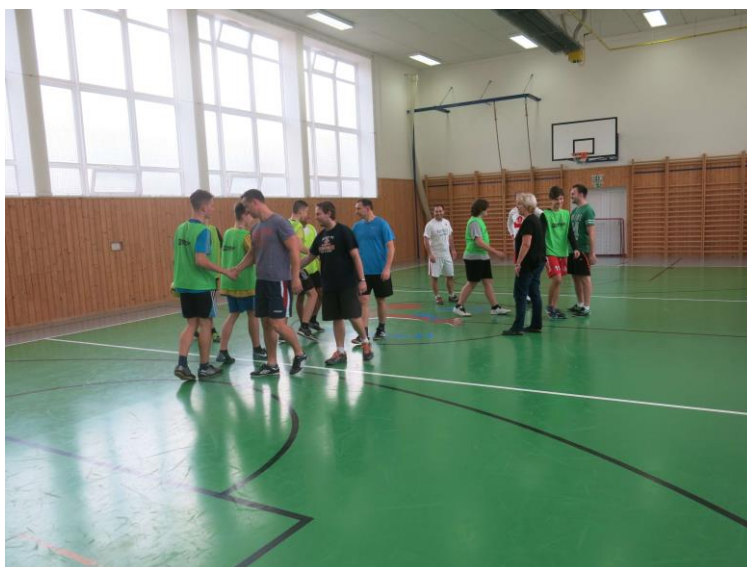
Předvánoční přátelský fotbalový zápas mezi žáky a učiteli

Ve školním roce 2017/2018 jsme pokračovali v práci s individuálně integrovanými žáky se zaměřením na fotbal ve třídách 6. A, 7. A, 8. A, 9. A. Za kvalitu integrace zodpovídal učitel tělesné výchovy Mgr. Zbyněk Vrána.