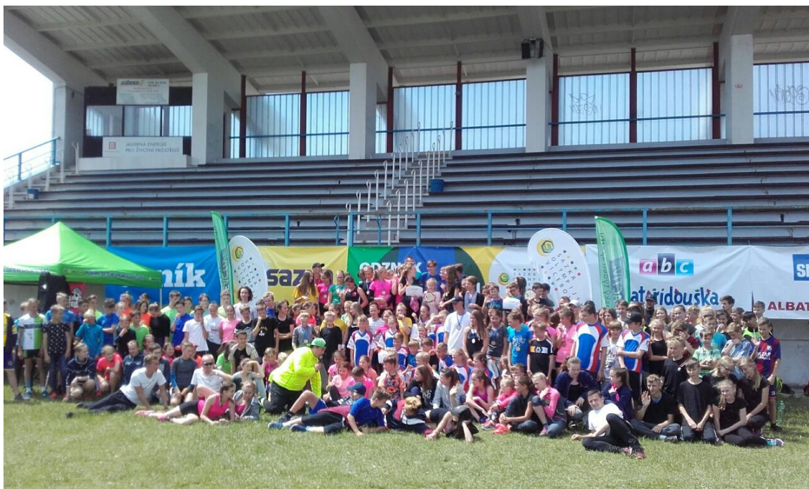
Krajské kolo OVOV v Třebíči

V celkovém součtu bodů z desetiboje (okresní + krajské kolo) žáci získali 4 zlaté a 5 stříbrných odznaků všestrannosti olympijských vítězů.