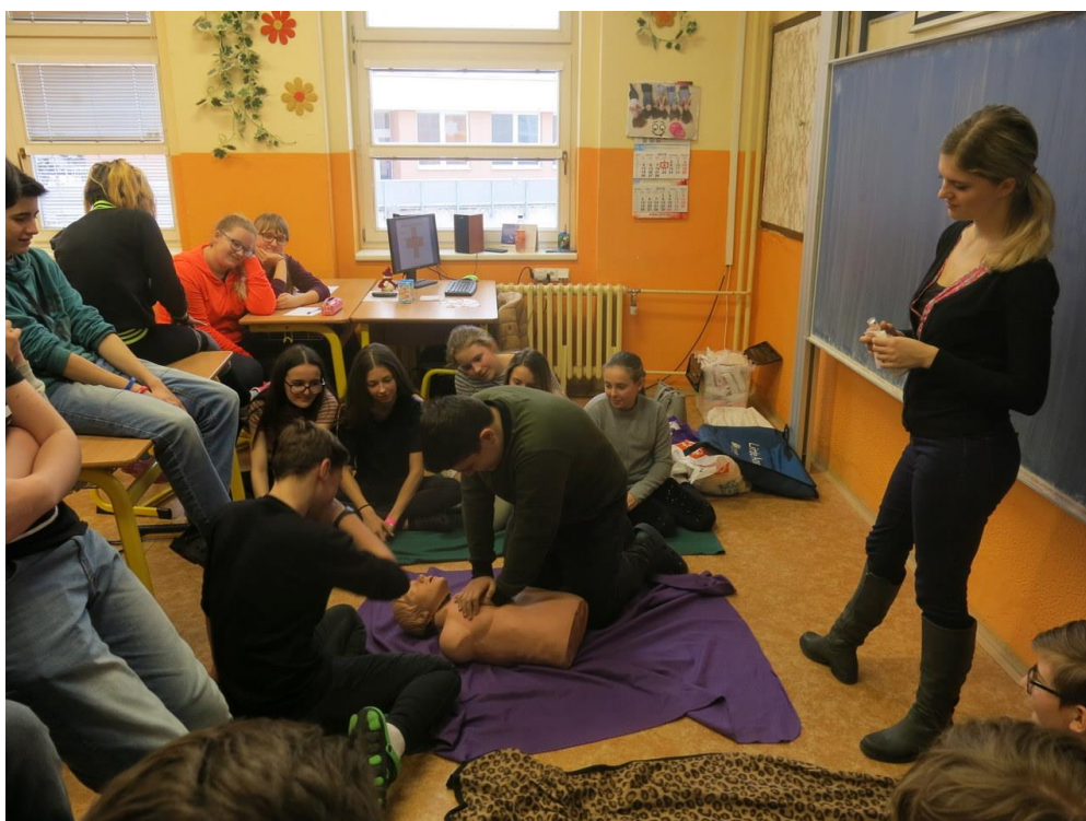
První pomoc do škol v 8. ročníku

Na vlnách přátelství – I. a II. stupeň Bezpečné chování na ulici – 1. ročník Bezpečné chování doma – 2. ročník Bezpečné chování na silnici - 3. ročník Pravidla silničního provozu – 4. ročník Kyberšikana - 5. ročník Závislost – 6. ročník Ochrana majetku - 7. ročník Šikana, kyberšikana – 8. ročník Domácí násilí – 9. ročník Na vlastní kůži (6. C) ČČK – prevence dětských úrazů Den zdraví Den bez tabáku Jom ha-šoa Beseda s SPC Jihlava Preventivní program – agentura Hobit (3. C) Charitativní koncert ve prospěch spolku pro lůžkový hospic Mezi stromy Než užiješ alkohol, užij svůj mozek – osvětová beseda Kurz první pomoci – 8. ročník První pomoc do škol – 8. ročník