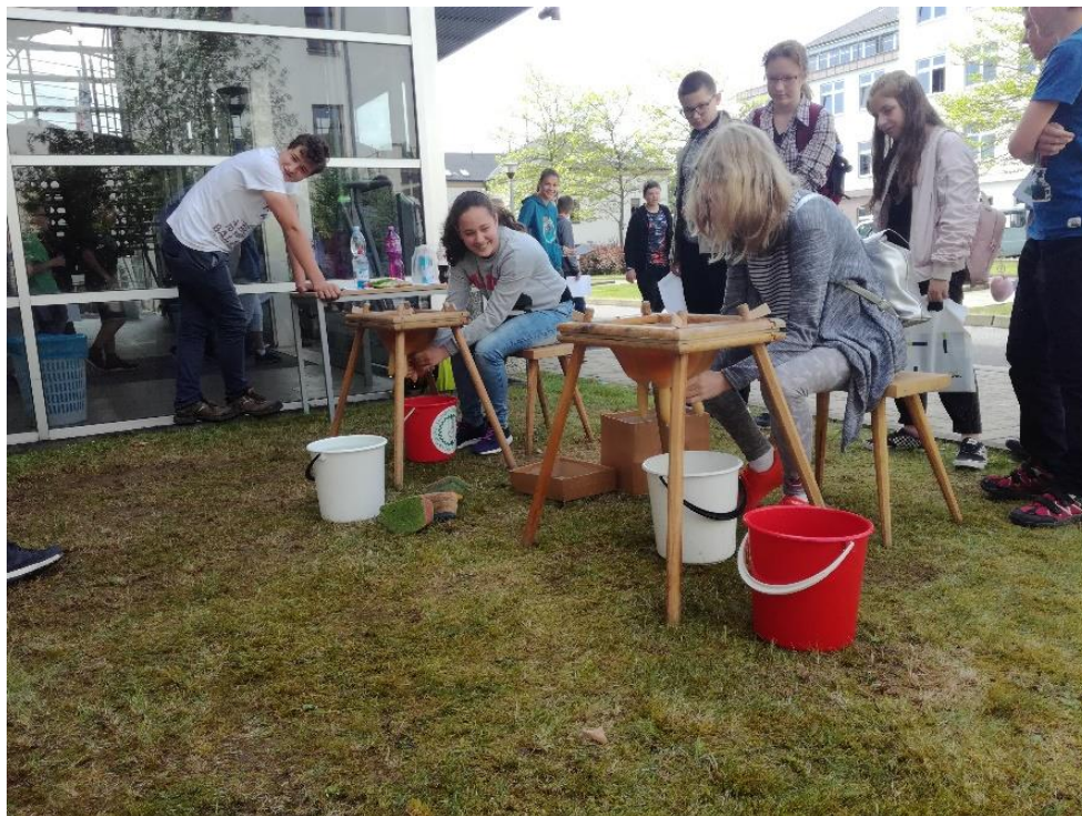
Zemědělství na Vysočině