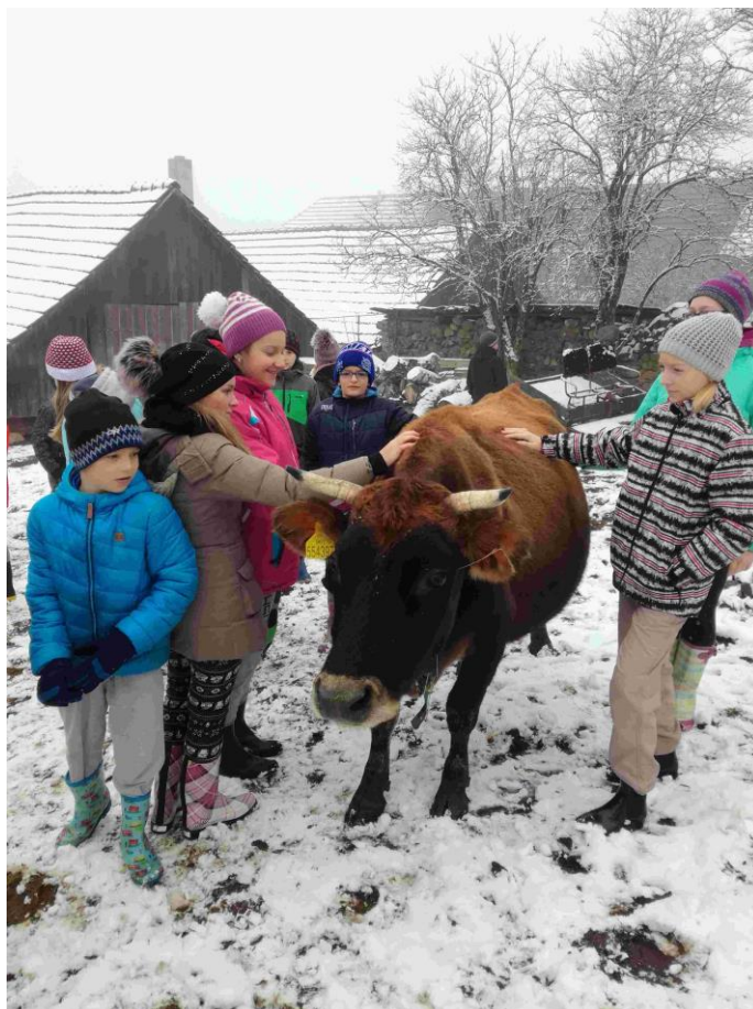
Žáci 6. ročníku v ekocentru Chaloupky

27. 11. - 1. 12. 2017 Chaloupky – pobyt s tematikou environmentální výchovy – 6. ročník 14. – 17. 5. 2018 Orlické hory – chata Kačenka – sbor Oříšek – 6. – 9. ročník 11. – 15. 6. 2018 Sportovně ozdravný pobyt s výukou anglického jazyka – Chlum u Třeboně – 4. a 5. ročník