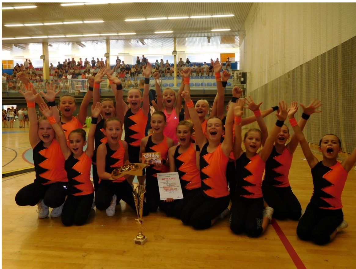
Zlatý Havlíčkobrodský střeříček pro děvčata ze ZŠ V Sadech

Aerobičky získaly obrovský zlatý pohár, diplom, sladký koláč a čokoládové bonbóny. Skvělé ukončení tanečního roku!!!