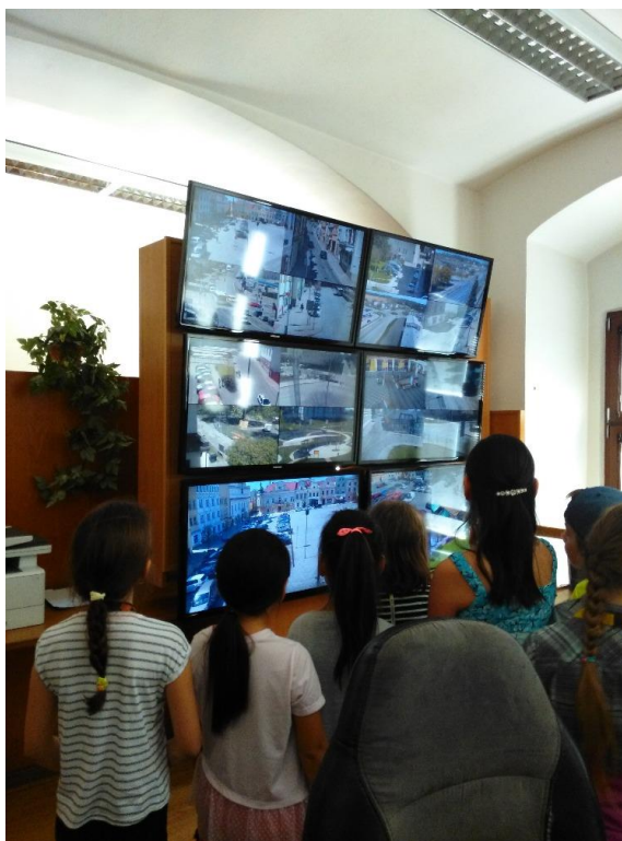
Školní družina na služebně MP