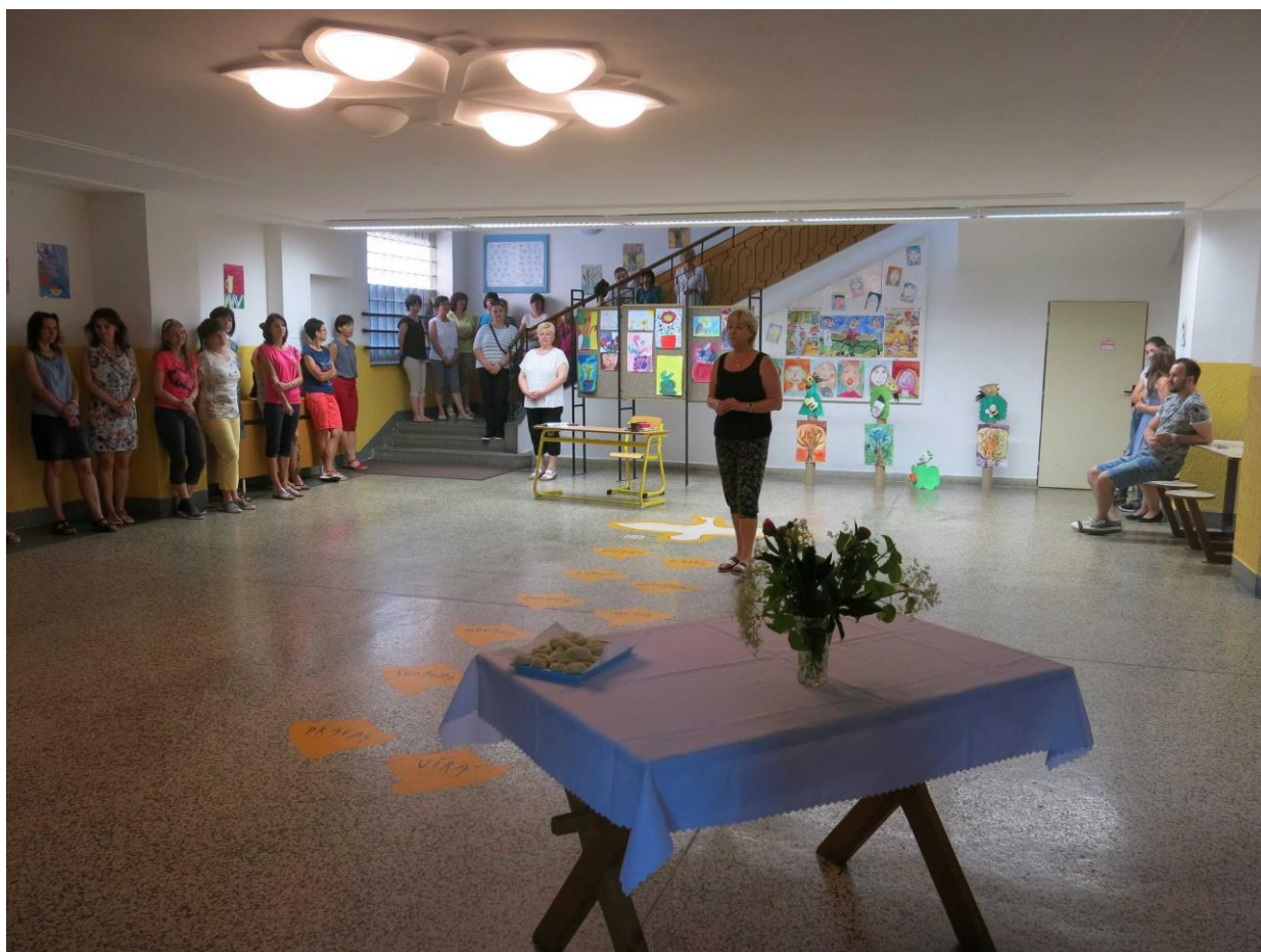
Pojďte s námi do školy – slavnostní zahájení