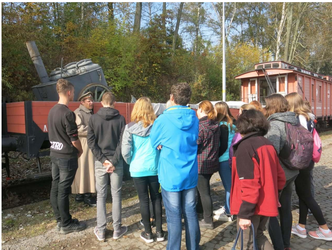
Devátáci v LEGIOVLAKU