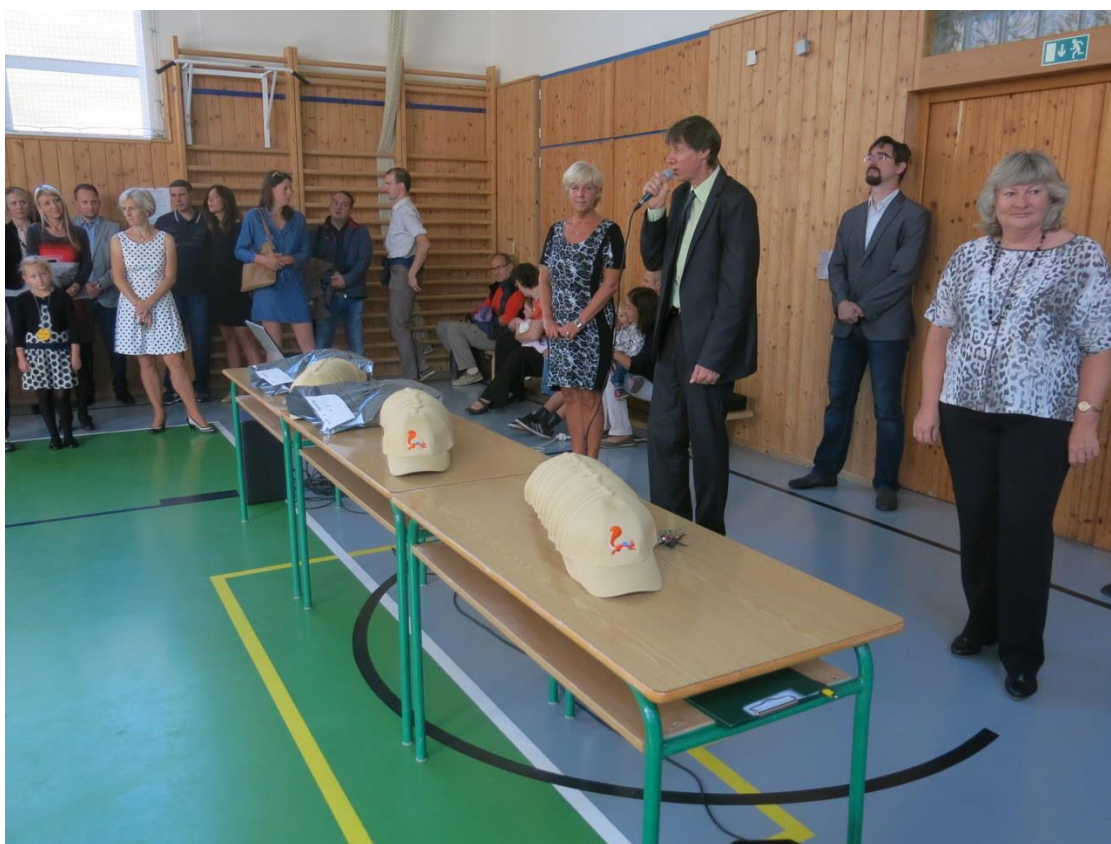
Slavnostní čepicování prvňáčků – 4. září 2017

Den otevřených dveří pro rodiče budoucích prvňáčků Čepicování prvňáčků Informační schůzka pro rodiče žáků 6. a 9. tříd Vánoční koncert Oříšku Jarní koncert Oříšku Předvánoční keramika pro rodiče Keramické dílny pro rodiče s dětmi Keramika pro dospělé Schůzky rodičů se zástupci středních škol Sběrová akce Žijeme spolu aneb Napříč generacemi Školské fórum Schůzky SRPDŠ Pojďte s námi do školy (sobota 26. 5. 2018) – celodenní akce pro rodiče s dětmi s řadou soutěží, prohlídkou školy, školní zahrady a věže kostela Víkend otevřených zahrad Schůzka s rodiči budoucích prvňáčků Ozdravné pobyty Slavnostní prezentace závěrečných prací žáků 9. ročníku Vystoupení dramatického kroužku školní družiny Cyklovíkend – žáci a rodiče 4. C Setkání rodičů s místostarostkou pověřenou vedením resortu školství