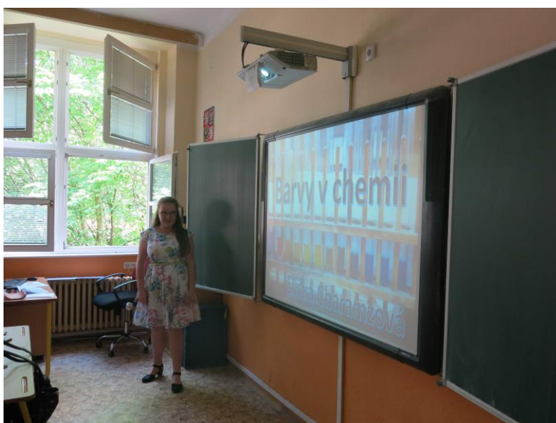
Některé závěrečné práce žáků 9. ročníku byly připraveny ve spolupráci se středními školami