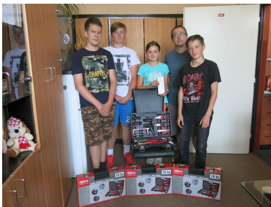
Stavíme z Merkuru