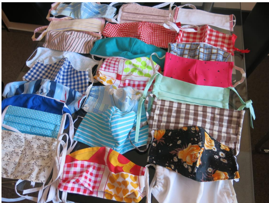
Vlastnoručně vyrobené roušky

984 – tolik roušek našili zaměstnanci naší školy, nejaktivnější byly paní kuchařky. Část slouží pro zaměstnance a žáky naší školy, ale více než 700 roušek jsme rozdali na potřebná místa: DD Reynkova, DD Věž, Nemocnice Havlíčkův Brod, kontaktní a poradenské centrum Kolping (roušky pro drogově závislé) a MěÚ Havlíčkův Brod (roušky pro lidi bez domova).