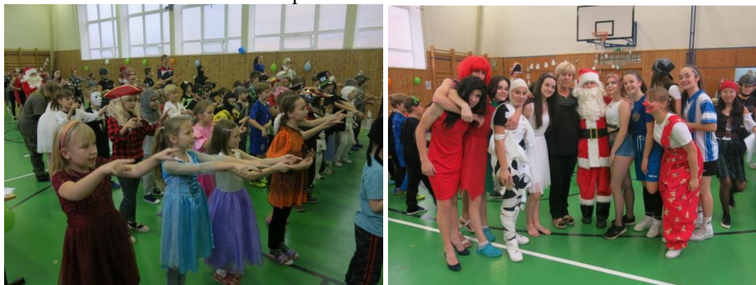
Karneval pro naše nejmenší zorganizovala 9. A