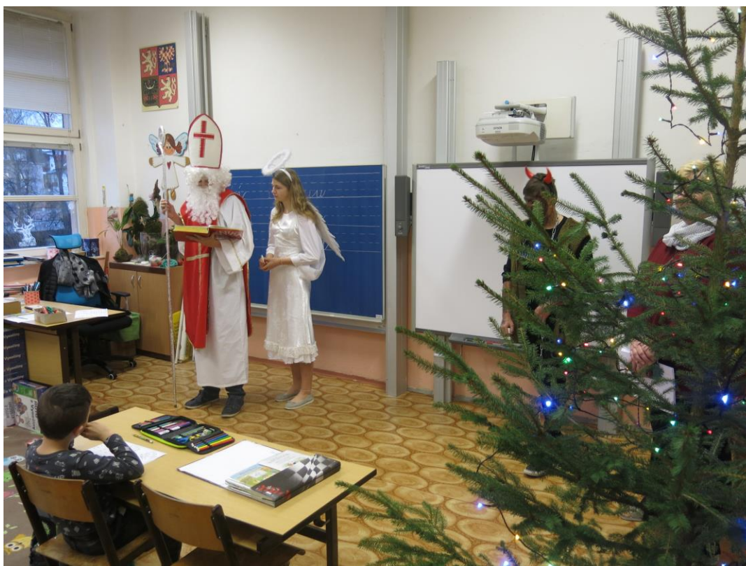
Mikuláš 2019 na ZŠ V Sadech