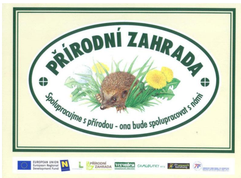
Školní zahrada při ZŠ V Sadech nese certifikát Přírodní zahrada

Naše školní zahrada má certifikát Přírodní zahrada - Spolupracujeme s přírodou - ona bude spolupracovat s námi.