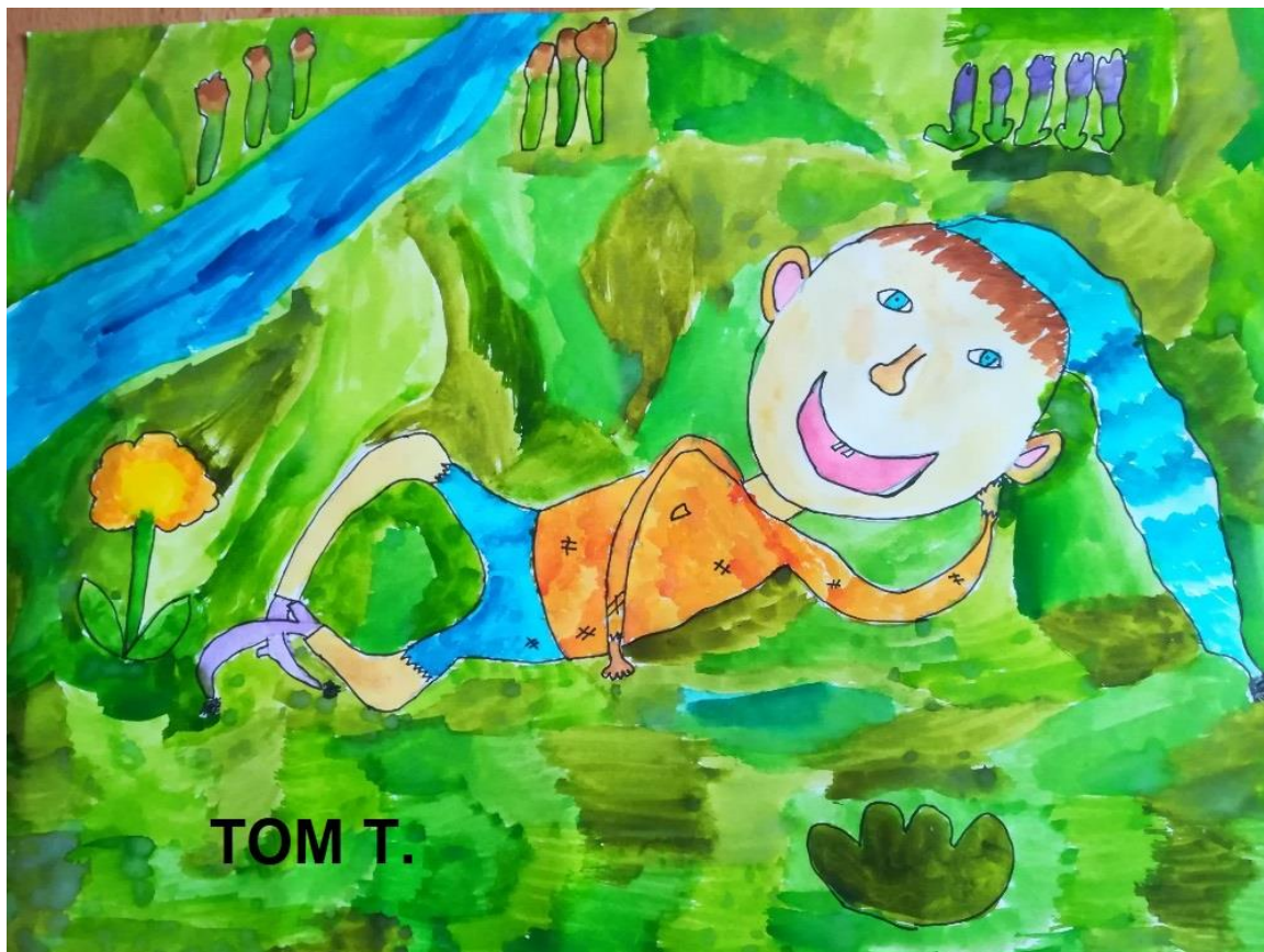
Oceněná práce Tomáše ze 4. C

Děti ze 4. C se během distanční výuky zapojily do soutěže nakladatelství Fraus: Můj skřítek . Děti měly za úkol skřítko namalovat a v angličtině popsat. Do soutěže se celkem zapojilo 243 dětí, 43 učitelů, 77 rodičů a 64 škol.