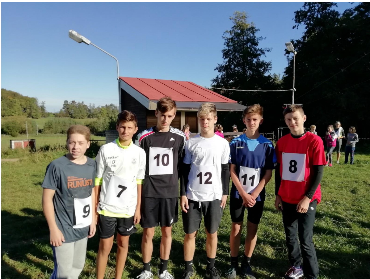
Přespolní běh - úspěšné družstvo atletů postoupilo do krajského kola