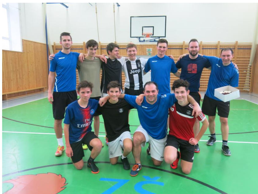
Předvánoční fotbalový turnaj