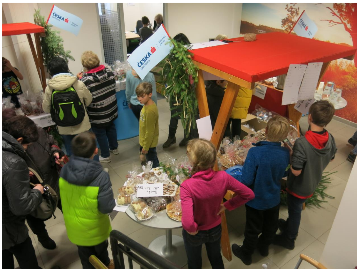
Předvánoční jarmark v budově České spořitelny – třída 5. B