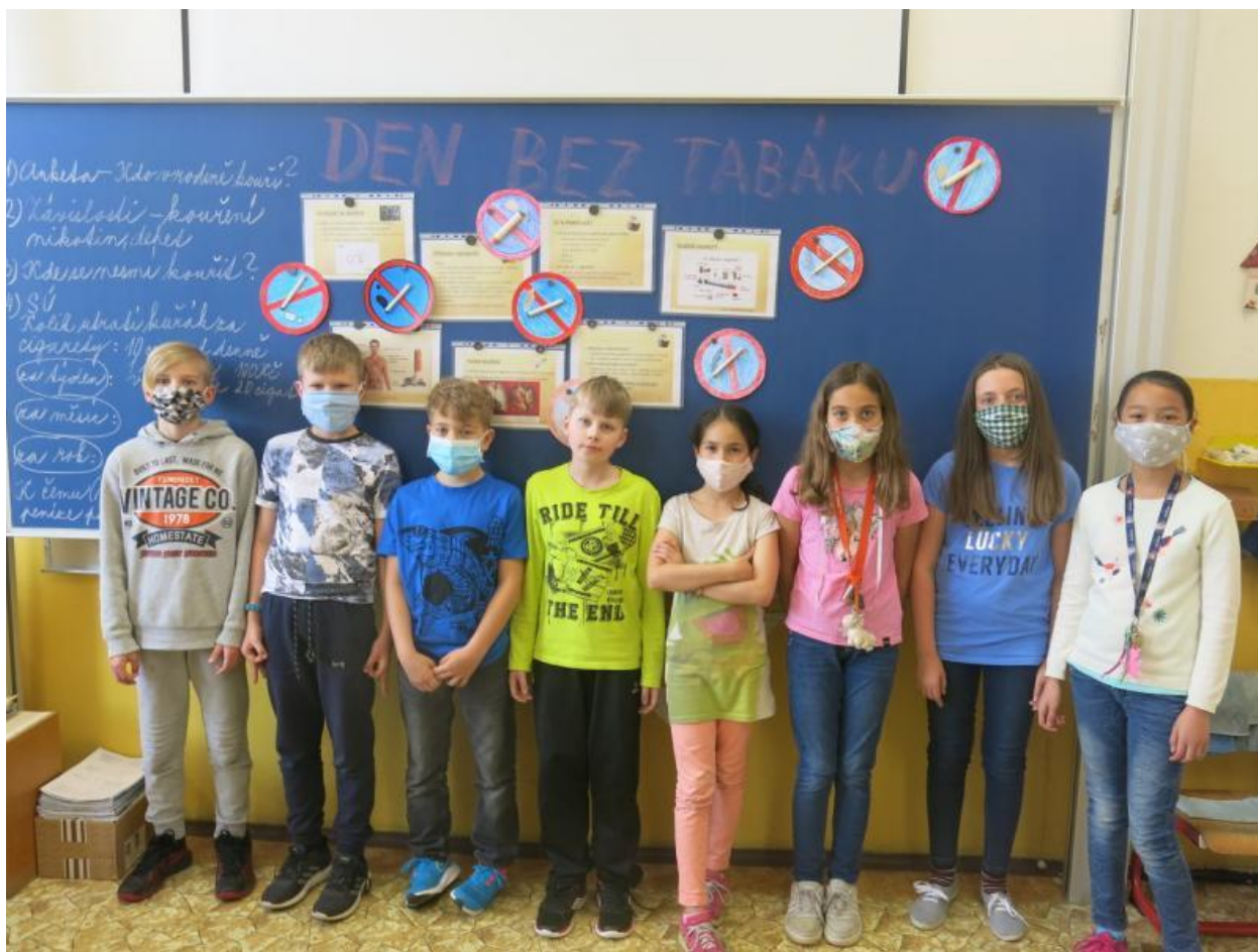
Den bez tabáku – jedna z mála osvětových akcí, které ve II. pololetí proběhly