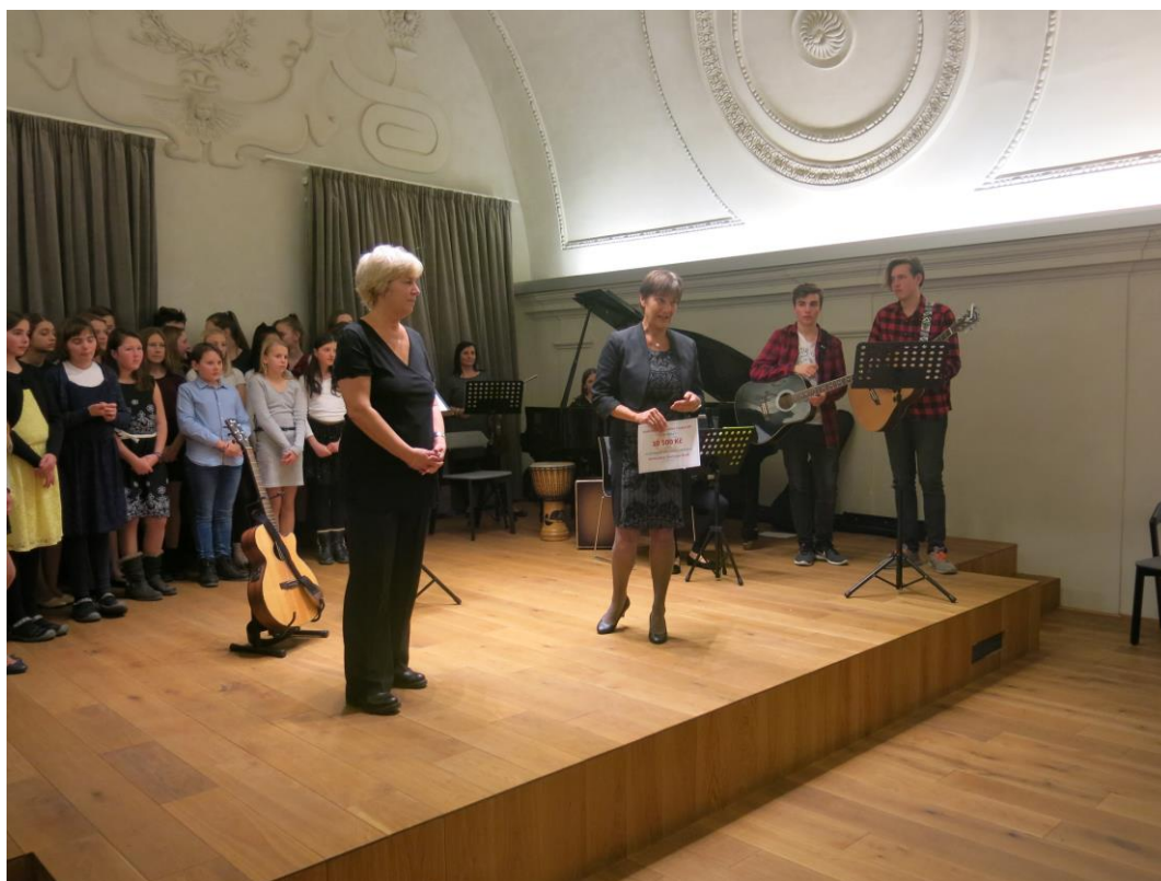
Benefiční koncert Oříšku přispěl na dobrou věc