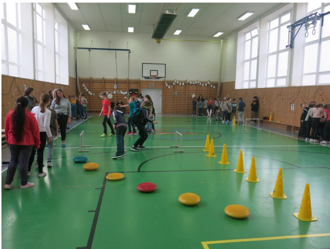
Vánoční pásmo soutěží a her pro změnu uspořádala 9. C