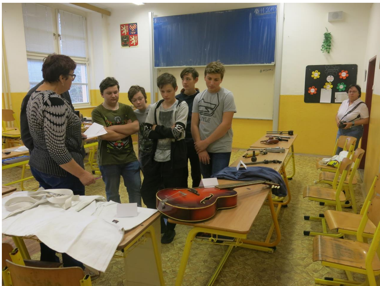
30. výročí sametové revoluce – soutěžní kvíz „Poznáš retro předměty?“

Pomyslnou třešničkou na dortu připomínkových akcí ke 30. výročí sametové revoluce byl projektový den ve stylu retro. Žáci II. stupně byli doslova vtaženi do historie let (ne)dávno minulých prostřednictvím řady dílen, soutěží a her. Celý program měl velký úspěch a vyvolal u dětí mnoho otázek, na které jim ochotně odpovídali jejich učitelé.