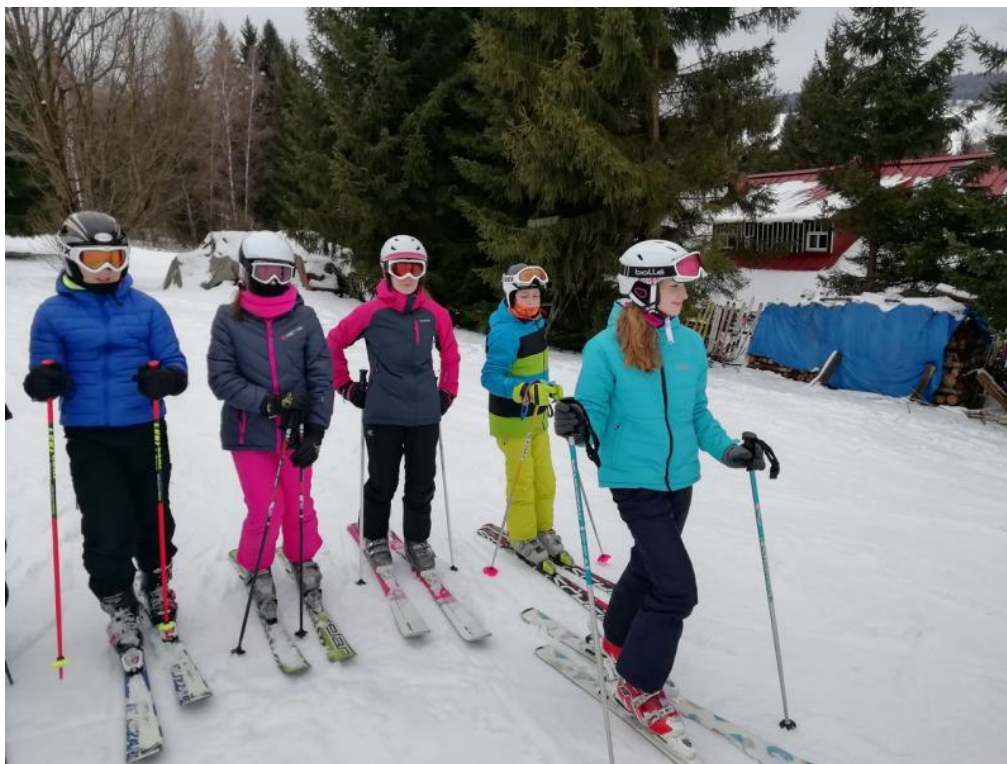
Lyžařský výcvikový kurz pro žáky 7. ročníku – Vítkovice, Krkonoše

7. 1. – 8. 2. 2020, I. stupeň – lyžařská škola Zajda – Šacberk