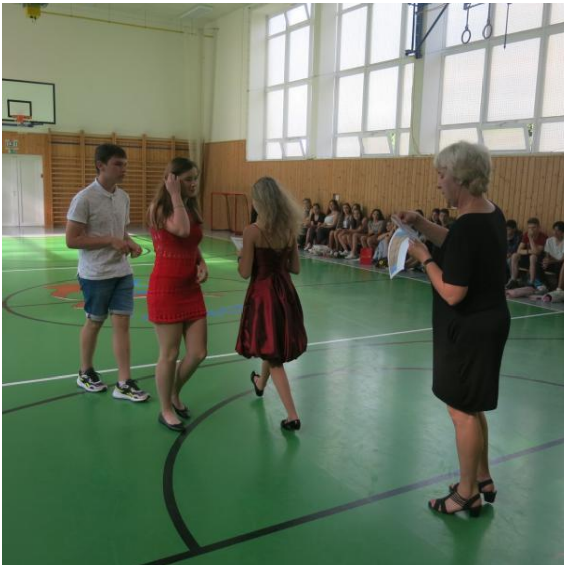
Motivační program žáků 9. ročníku – slavnostní vyhlášení výsledků

V rámci motivačního programu zpracovávali žáci 9. ročníku závěrečné práce. I letos jsme navázali vynikající spolupráci s SPŠS a GHB. Žáci 9. tříd, kteří projeví zájem o studium na SPŠS, zpracovávali své závěrečné práce pod odborným vedením garantů ze SPŠS a využívali materiální vybavení i informační technologie přímo na střední škole. Budoucí gymnazisté měli provádět praktickou část závěrečné práce v badatelském centru GHB, ale vzhledem k mimořádným opatřením k uzavření škol k tomu již nedošlo.