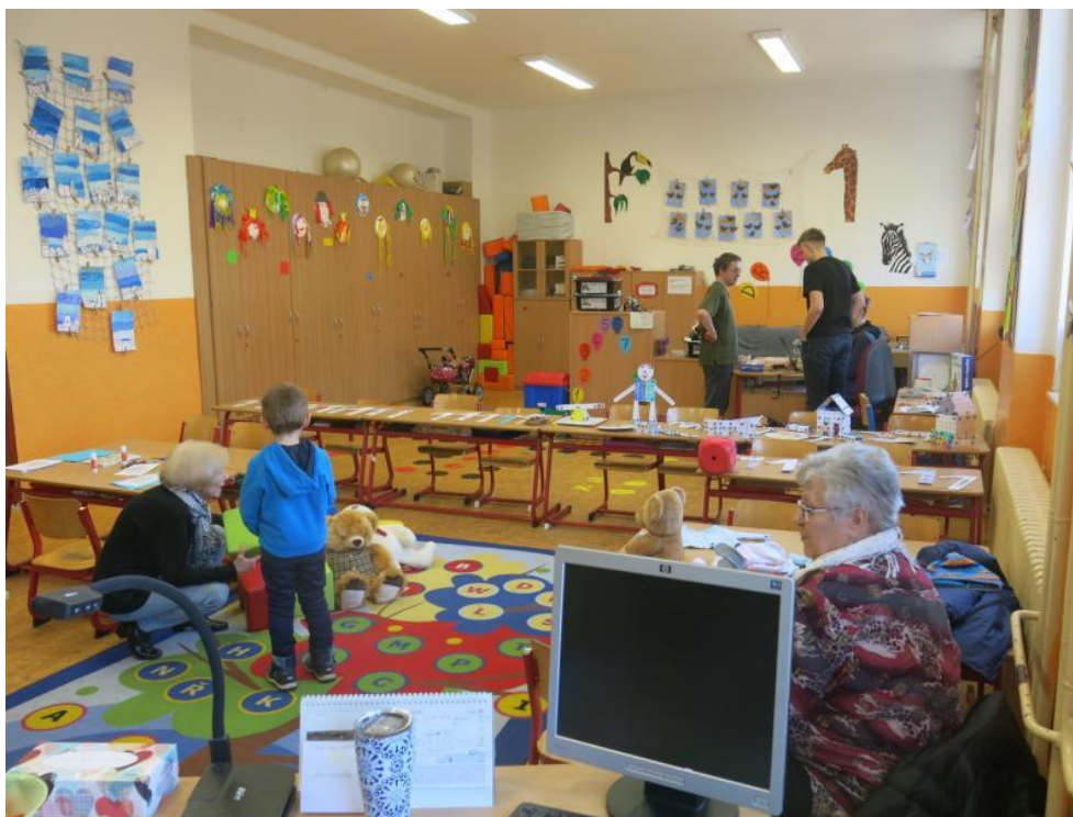
Den otevřených dveří pro rodiče budoucích prvňáčků