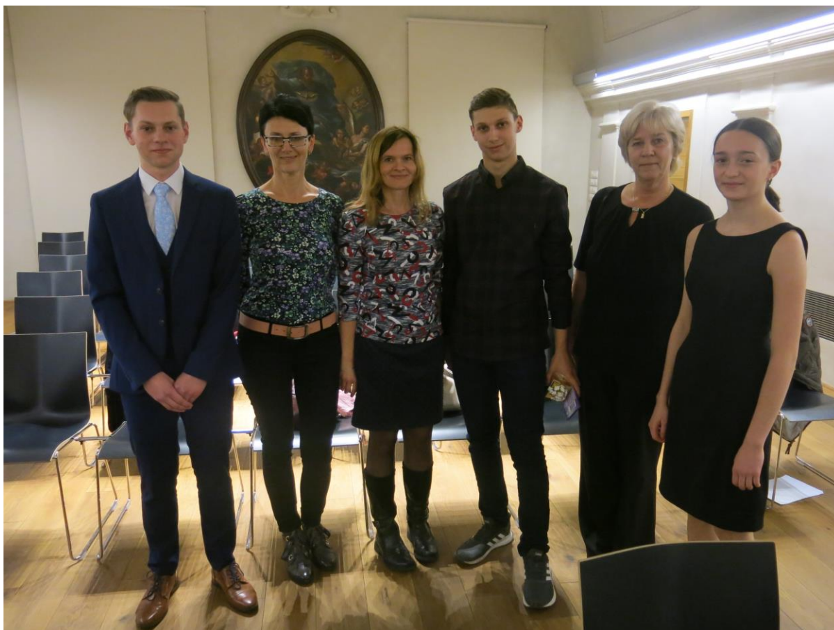
CENY MĚSTA HAVLÍČKŮV BROD 2019 – slavnostní večer v sále Staré radnice