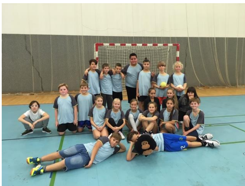
Školní liga miniházené – družstvo 5. C

Žáci 5. C absolvovali podzimní část Školní ligy v miniházené a pod zkušeným vedením paní učitelky Šimoníčkové obsadili 2. a 4. místo, což je vzhledem k silné konkurenci havlíckobrodských a světelských základních škol velký úspěch. Budeme držet palce, aby se našim páťákům dařilo i v jarní části soutěže.