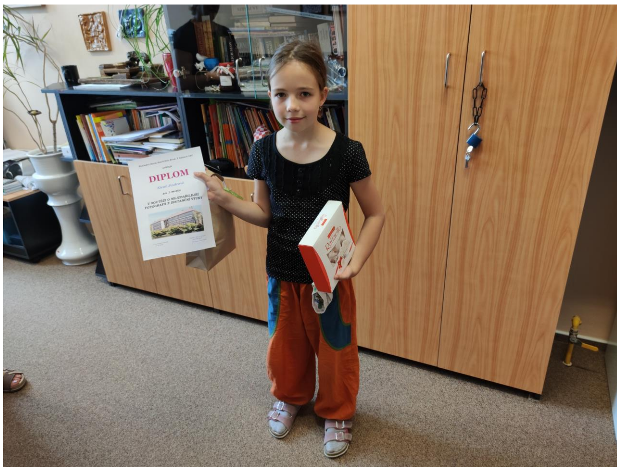
Soutěž o nejzdařilejší fotografii v době distanční výuky - slavnostní předávání cen v ředitelně školy