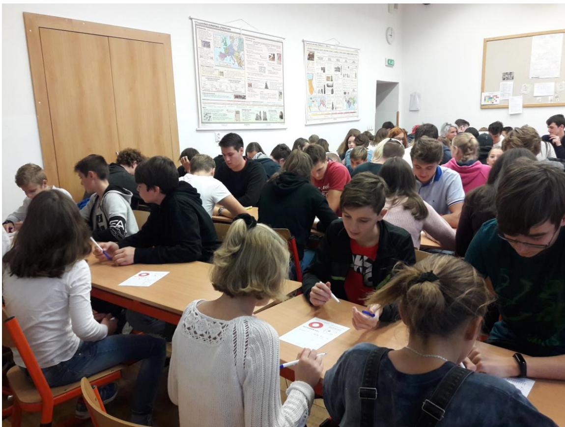
Piškvorky – Bery Team v akci