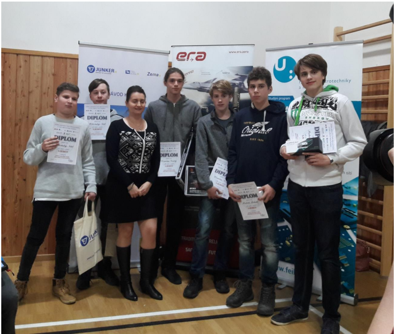
Pardubická soutěž S-ROBOT a stříbrní žáci 9. ročníku