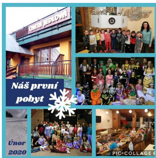
Ozdravný pobyt prvňáčků a jejich rodičů – chata Jedlová, Orlické hory