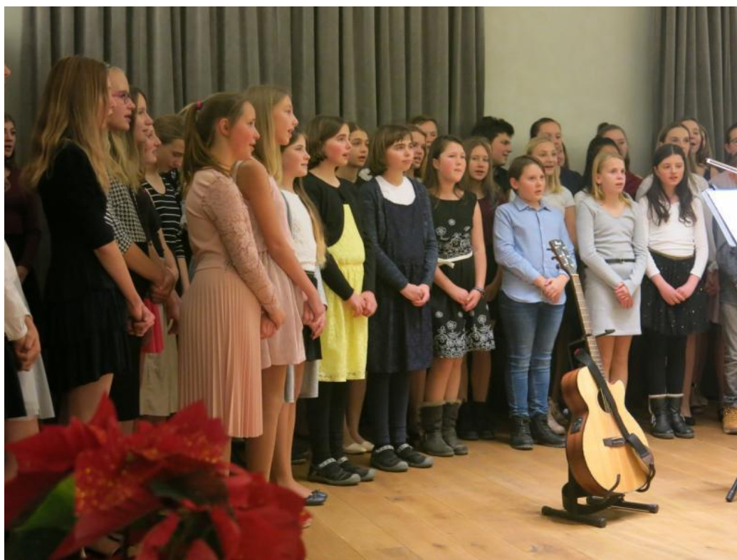
Z koncertů pěveckého sboru Oříšek