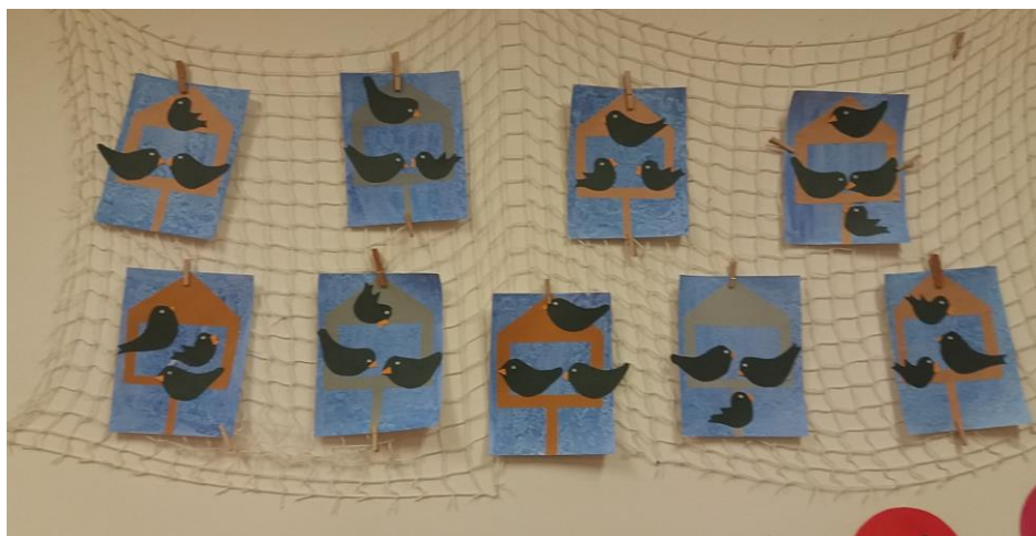
Krmítka pro ptáčky – práce dětí ze školní družiny