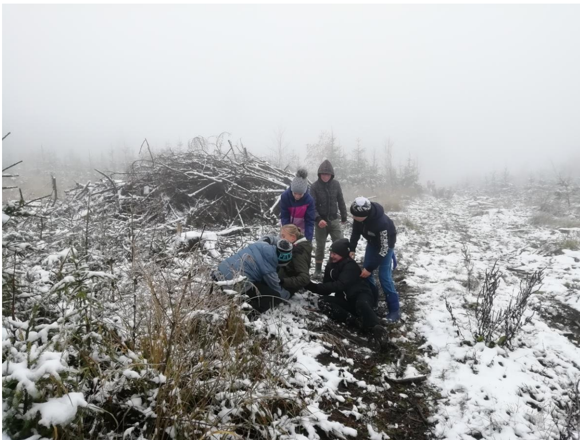
Žáci 6. D a 8. B v EKOCENTRU Chaloupky

Naše školní zahrada má certifikát Přírodní zahrada - Spolupracujeme s přírodou - ona bude spolupracovat s námi.