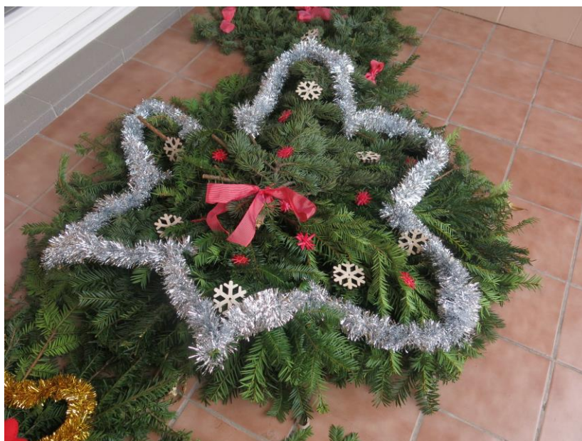
Havlíčkobrodské vánoční trhy ozdobily také kytice ze Sadů

Žáci i učitelé naší školy se s chutí zapojili do přípravy kytic, které letos v době konání vánočních trhů ozdobí prodejní stánky na Havlíčkově náměstí.