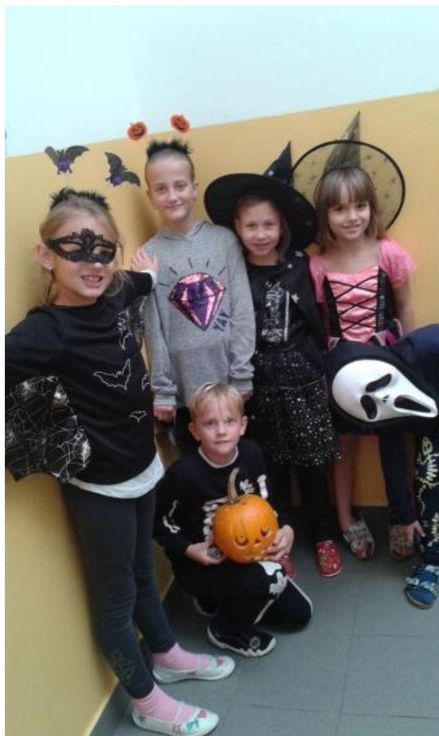
Halloween na ZŠ V Sadech