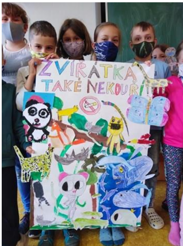
Den bez tabáku na ZŠ V Sadech – tentokrát v rouškách

Opět po roce proběhl na ZŠ V Sadech Den bez tabáku. Děti si tentokrát v rouškách připomněly základní informace o závislosti na kouření a zásady zdravého životního stylu. V malých, maximálně patnáctičlenných skupinkách malovaly, stříhaly, lepily, luštily křížovky, poslouchaly pohádku, zhlédly kreslený film O ZLÉ CIGARETĚ. Deštivé dopoledne tak všichni strávili sice ve třídách, ale domů odcházeli plni dojmů.