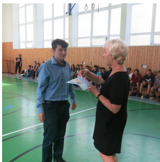
Slavnostní vyhlášení výsledků MOTIVAČNÍHO PROGRAMU v 9. ročníku

Přijato žáků: gymnázia - 12 SŠ a SOŠ s maturitou - 74 učební obory bez maturity - 13 víceletá gymnázia – 10