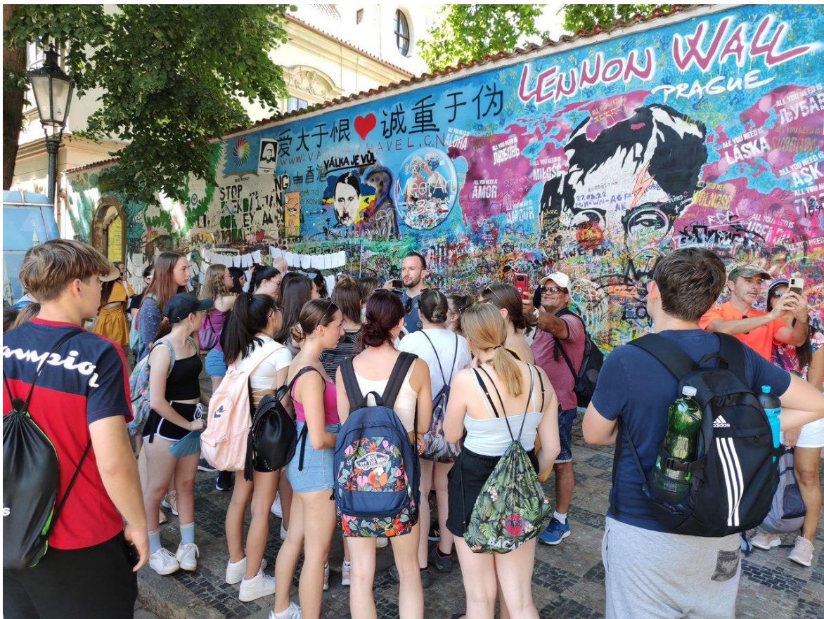
Projekt Ještě nekončíme