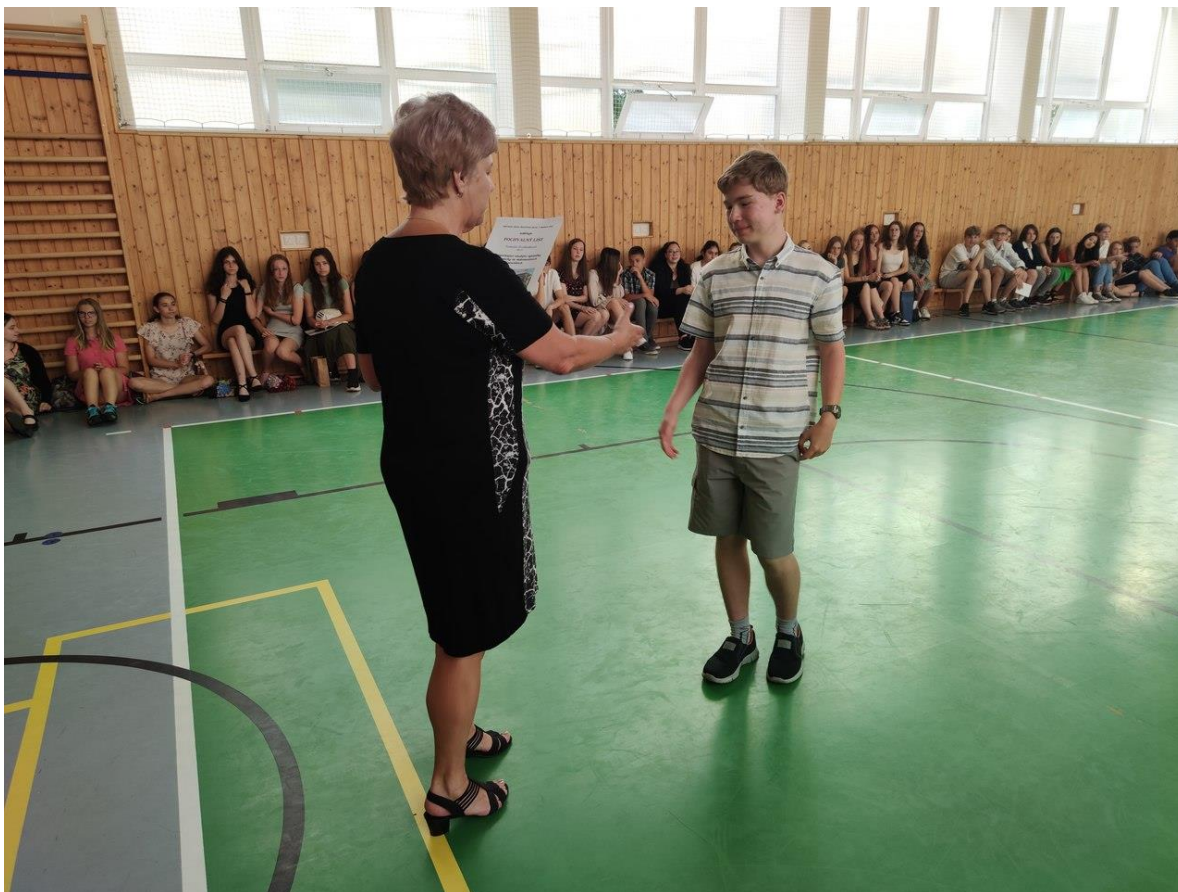
Motivační program žáků 9. ročníku – slavnostní vyhlášení výsledků