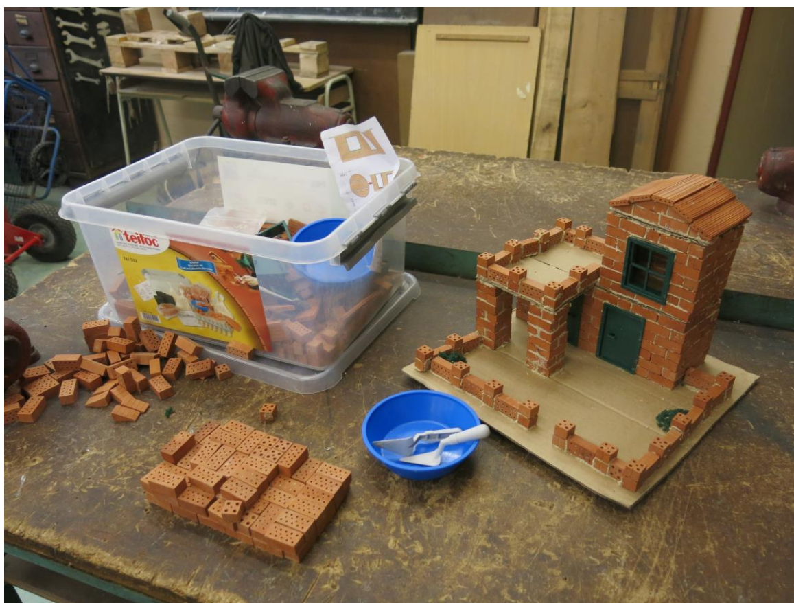
Práce se stavebnicí Teifoc