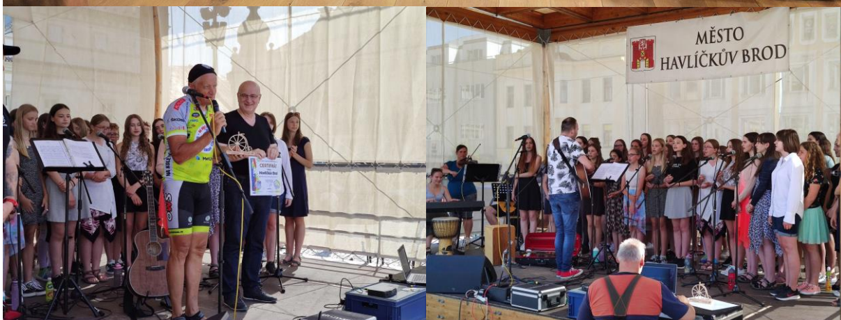
Z vystoupení pěveckého sboru Oříšek