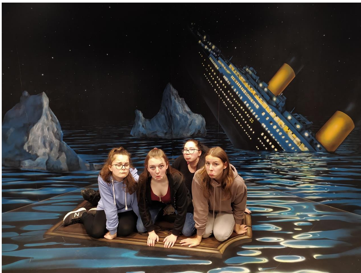
Nečekané zážitky v Muzeu optických iluzí

Muzeum optických iluzí Praha – 9. ročník