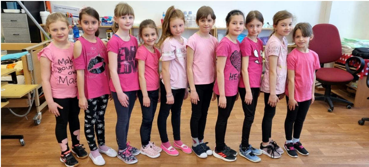
Vystoupení dětí ze školní družiny