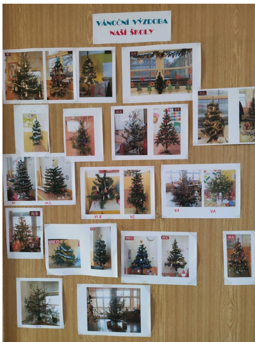
Nejhezčí vánoční stromečky ve třídách I. a II. stupně

Světový den bez tabáku – PT, I. stupeň Podzimní dílny – I. stupeň Dýňový svět – 4. ročník Proč si obout italskou botu? - 4. ročník Den bez aut – ŠD, I. stupeň Po stopách bitvy tří císařů – 8. ročník Čas pro listnaté stromy – ŠD Den stromů – ŠD Podzimní tvoření – ŠD Podzimní mandaly – ŠD Léčivé byliny – ŠD Valentýnská přání – ŠD Den Země – ŠD Evropský den Slunce - ŠD Den matek – ŠD