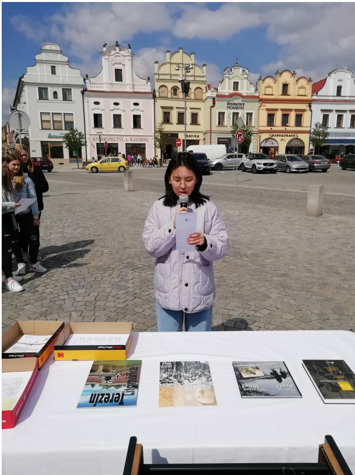
Veřejné čtení jmen obětí holocaustu