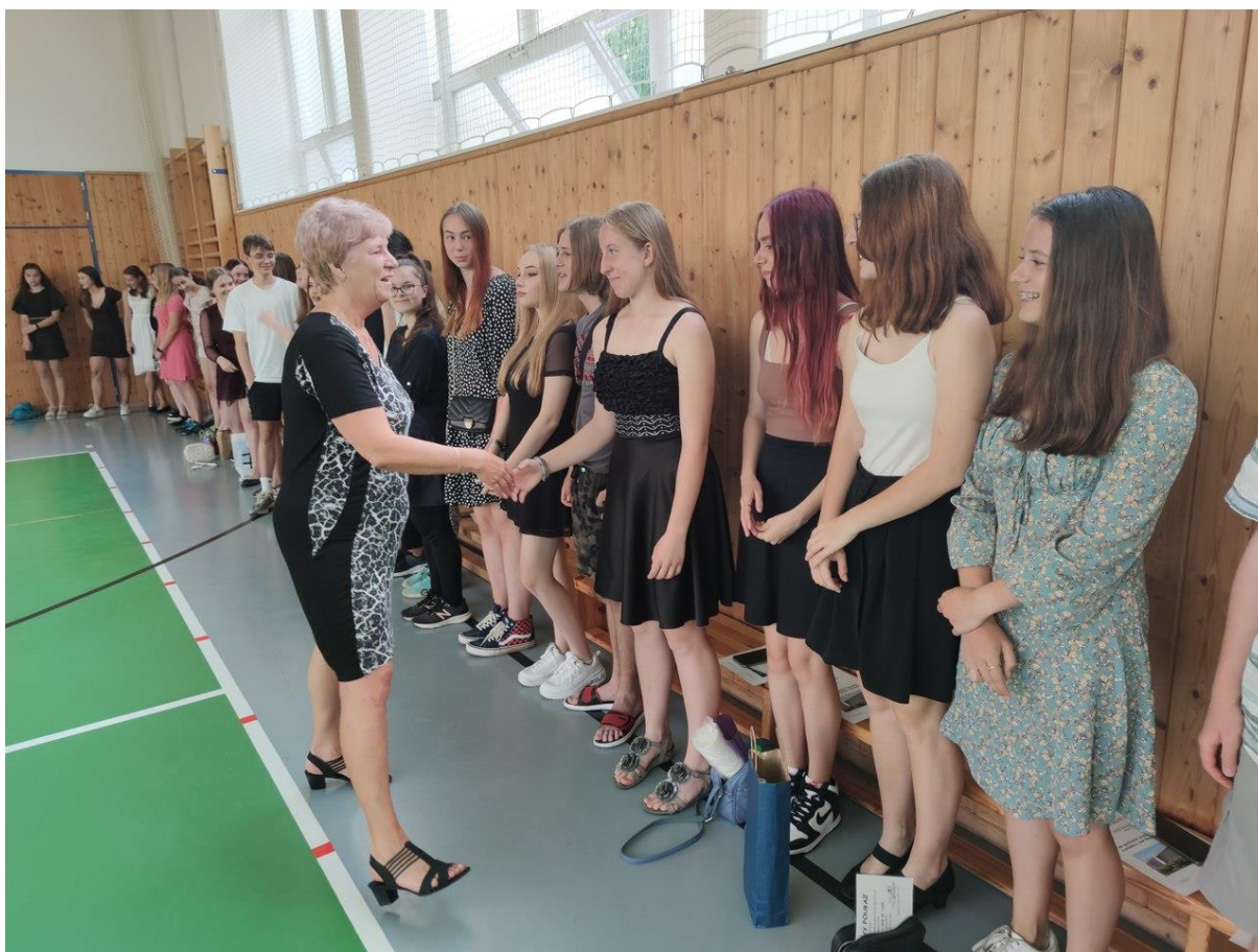
Slavnostní závěr školního roku, rozlučka s devětáky