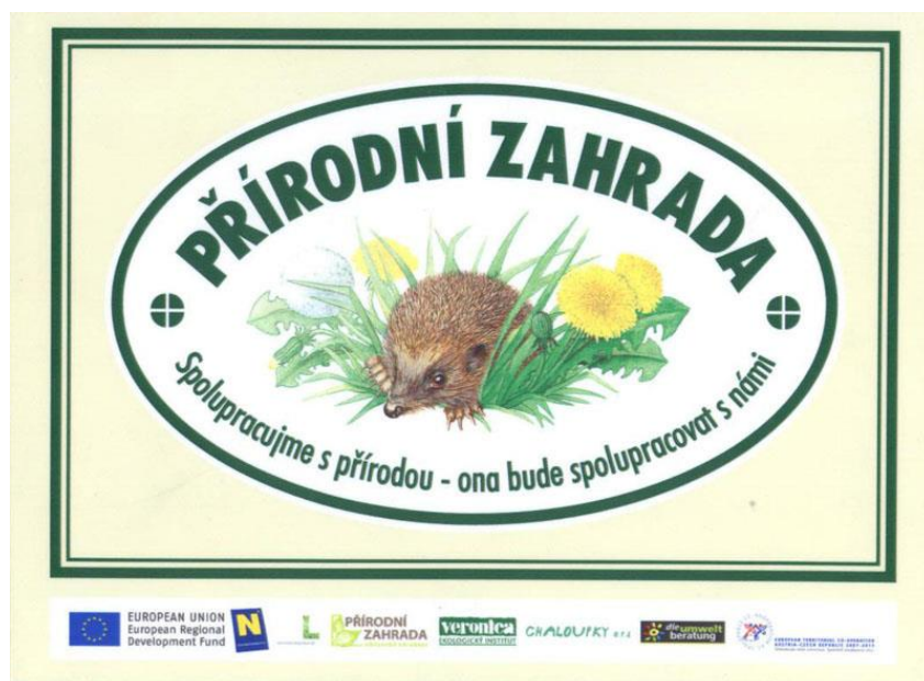
Školní zahrada při ZŠ V Sadech nese certifikát Přírodní zahrada

Naše školní zahrada má certifikát Přírodní zahrada - Spolupracujeme s přírodou - ona bude spolupracovat s námi.