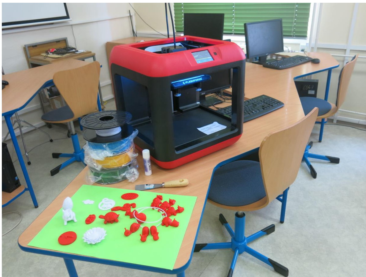
3D tiskárna v odborné učebně VT