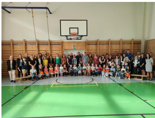
Těšíme se na budoucí prvňáčky i jejich rodiče

Na škole bude od 1. 9. 2022 opět zřízena přípravná třída s 10 žáky. Ve třídě bude pracovat také asistent pedagoga.