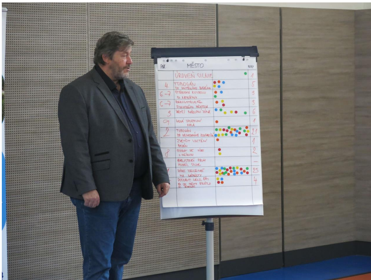
Školní fórum na ZŠ V Sadech – co bychom chtěli zlepšit v našem městě