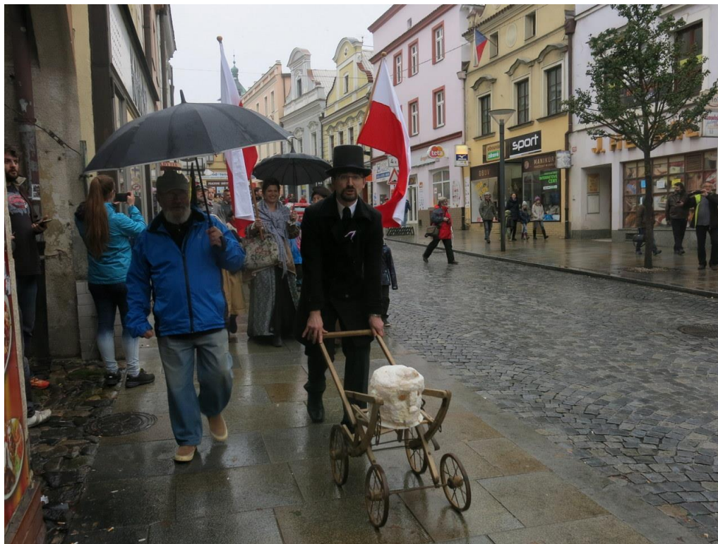
Recesistická akce k oslavám 100. výročí vzniku Československa

Zima – I. stupeň Jaro – I. stupeň Výroba dárků pro budoucí prvňáčky – I. a II. stupeň Školní fórum (5. – 8. ročník) Abeceda peněz – dětský jarmark (5. C, 5. D) Ještě nekončíme – 9. A, B, C