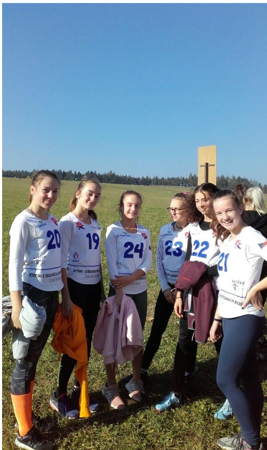
Stříbrné družstvo starších zákyň

Družstvo starších děvčat obsadilo v silné konkurenci sportovních škol 2. místo.