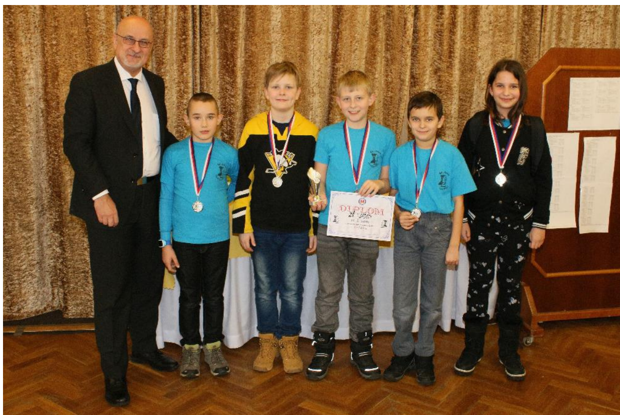
Naši šachisté potěšili i pana starostu

V kategorii A (1. stupeň) naši žáci vybojovali 2. místo a postup do krajského kola.