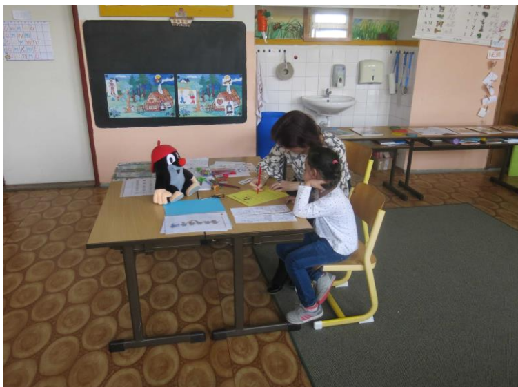
Zápis do 1. tříd