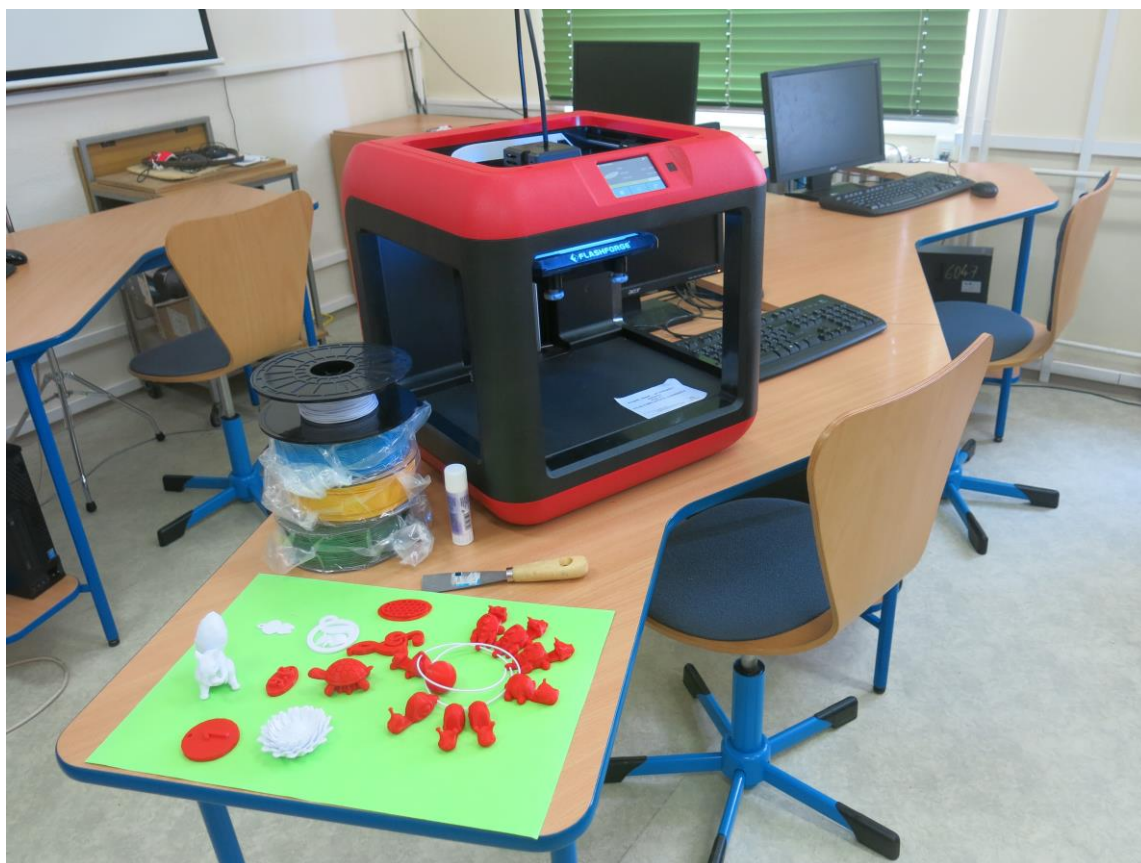
3D tiskárna v odborné učebně VT