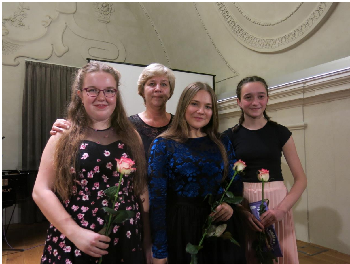
CENY MĚSTA HAVLÍČKŮV BROD 2018 – slavnostní večer v sále Staré radnice

Ceny města Havlíčkův Brod za školní rok 2018/2019 – navržení žáci: