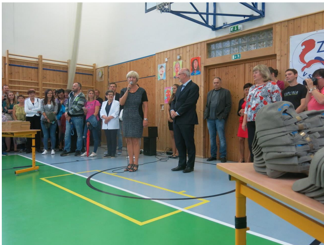
Čepicování prvňáčků s panem starostou – 3. září 2018

Předvánoční keramika pro rodiče Keramické dílny pro rodiče s dětmi Keramika pro dospělé Schůzky rodičů se zástupci středních škol Sběrová akce Schůzky SRPDŠ Pojďte s námi do školy (sobota 18. 5. 2019) – celodenní akce pro rodiče s dětmi s řadou soutěží, prohlídkou školy, školní zahrady Víkend otevřených zahrad Schůzka s rodiči budoucích prvňáčků Ozdravné pobyty Slavnostní prezentace závěrečných prací žáků 9. ročníku Vystoupení dramatického kroužku školní družiny Setkání rodičů s místostarostkou pověřenou vedením resortu školství a pracovníky SPC Jihlava Žák s PAS (projekt Šablony I) Aspergerův syndrom (projekt Šablony I) Poruchy chování u dětí (projekt Šablony I) Poradenství a další vzdělávání – ÚP (projekt Šablony I) Regionální trh práce (projekt Šablony I) Nabídka služeb SPC Jihlava (projekt Šablony I) Informace pro rodiče o nebezpečí sociální sítě TIK TOK (metodik prevence sociálně patologických jevů)