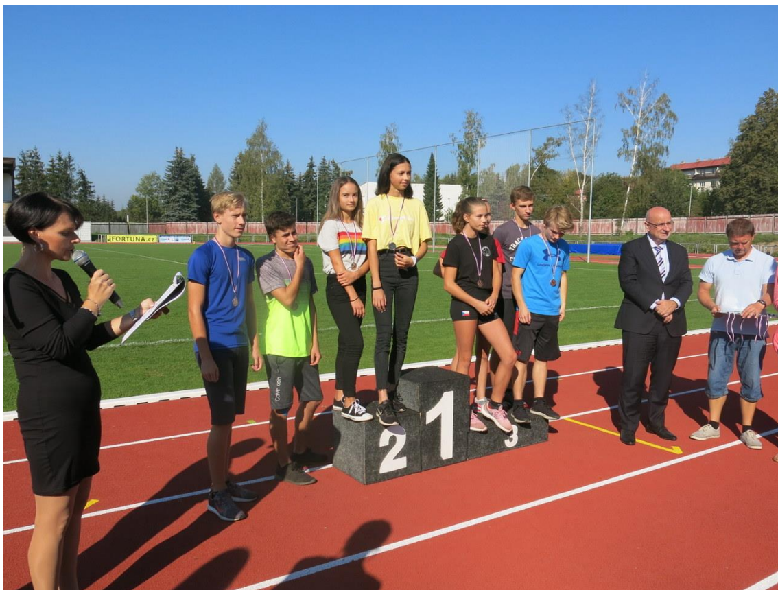
Štafety ze Sadů úspěšně testovaly nový lehkooatletický ovál

Závodníci ze ZŠ V Sadech se prezentovali velmi dobrým kolektivním výkonem a v mladší kategorii obsadili krásné 3. místo, starší družstvo pak zazářilo ještě víc, když vybojovalo dokonce stříbro.