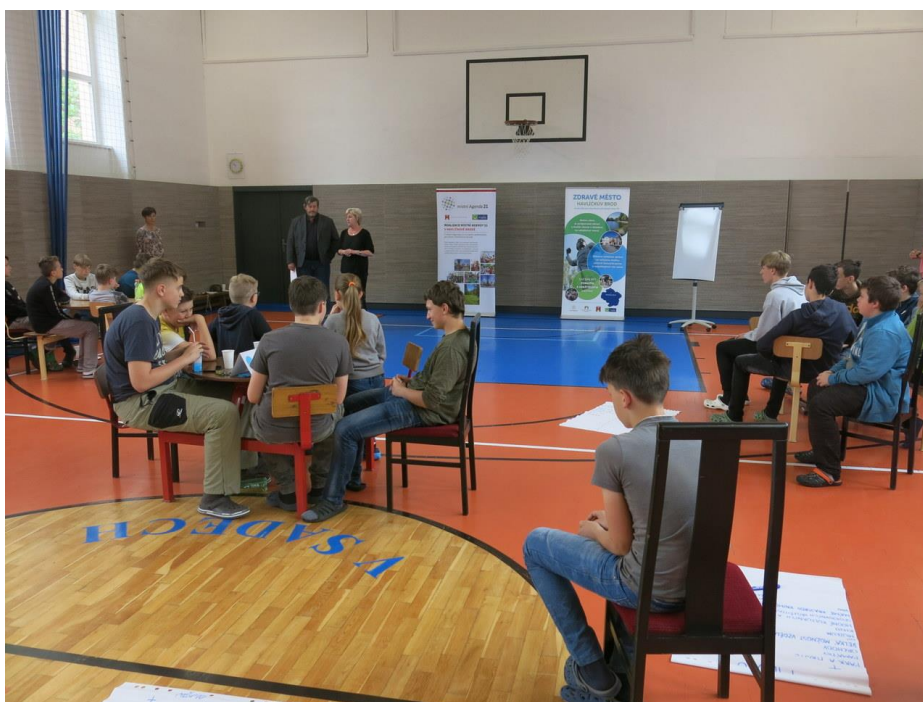
Školní fórum na ZŠ V Sadech