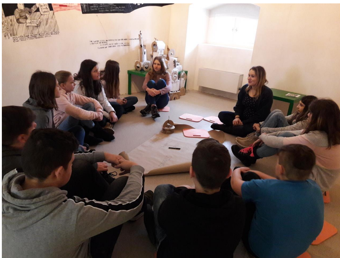
Devátáci v Muzeu nové generace