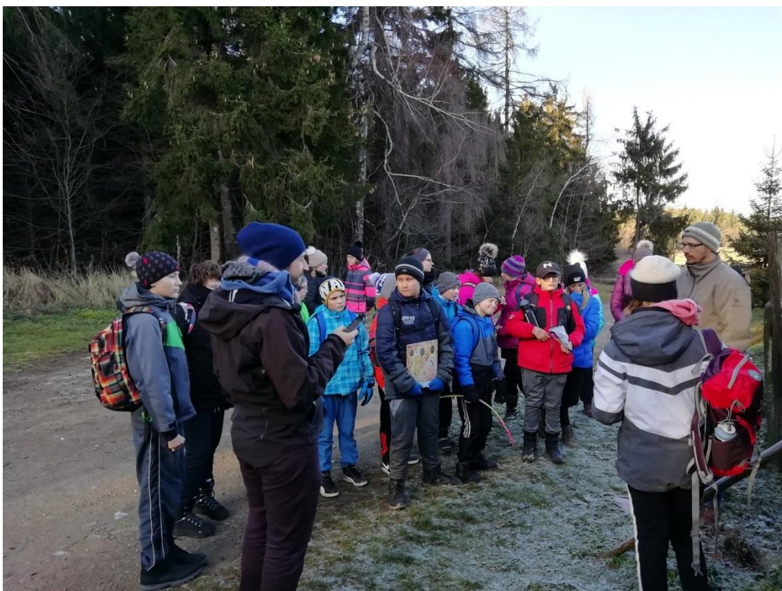
Sedmáci se vydali do EKOCENTRA Chaloupky

Čistá řeka Sázava (8. B, 8. C) Chaloupky - 7. B Den bez aut - I. a II. stupeň Den zdraví (I. stupeň) Den bez tabáku (I. stupeň) Žijeme ekologicky (I. stupeň) Žijeme zdravě (I. stupeň) Pohyb je život (I. Stupeň) Zdravý životní styl (I. stupeň) Bovýsek - ovoce a zelenina do škol Přeměna odpadů na zdroje – EMV – 9. a 7. ročník Zemědělství na Vysočině (II. stupeň) Recyklohraní Víkend otevřených zahrad Cvičení v přírodě Soutěže pro 5. ročník – biologická olympiáda, třídění odpadů (EMV 9. ročník) Sázíme bylinky – ŠD Mezinárodní den životního prostředí – třídíme odpad (ŠD) Mezinárodní den oceánů – omezení plastového odpadu doma i ve škole (ŠD) Sběr léčivých bylin Sběrová akce - starý papír Sběr kaštanů, žaludů a pomerančové kůry