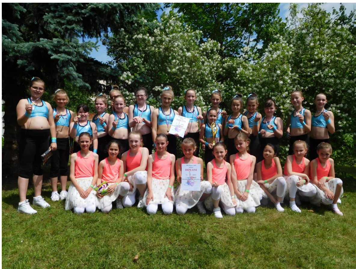
Aerobičky ze Sadů

Děvčata z kroužku aerobiku odstartovala sportovní jaro opravdu velkolepým způsobem, když ze soutěže Příbyslavský pantoflíček přivezla zlaté medaile.