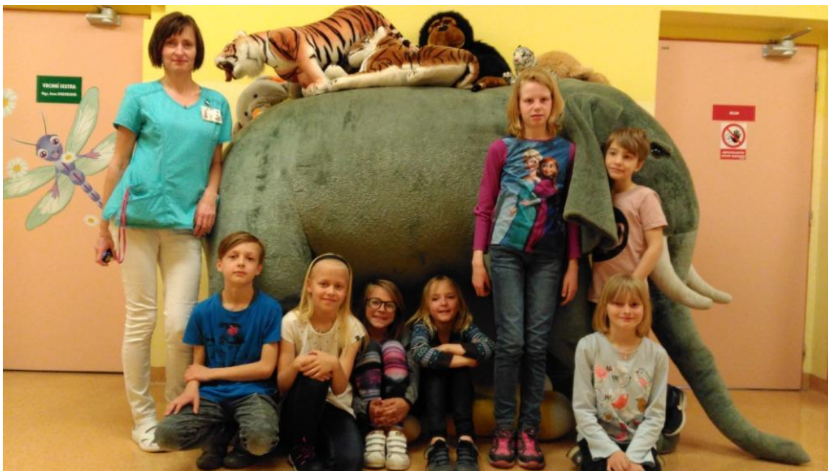
Školní družina na návštěvě v místní nemocnici