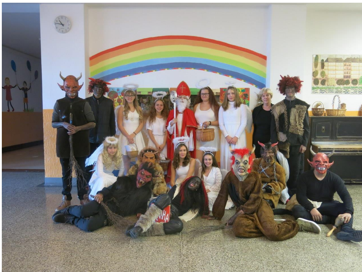
Mikuláš 2018 na ZŠ V Sadech

Prevence úrazů na kole – ŠD Evropský den parků - ŠD Noc kostelů – ŠD Den matek – ŠD Mezinárodní den rodiny – ŠD Sázíme bylinky – ŠD Mezinárodní den dětí – odpoledne plné her (ŠD) Mezinárodní den životního prostředí – třídíme odpad (ŠD) Mezinárodní den oceánů – omezení plastového odpadu doma i ve škole (ŠD) Mezinárodní den zvířat – malujeme na chodník oblíbené zvířátko, využití PET víček (ŠD) Světový den vody - ŠD Vánoční dílny – I. a II. stupeň Velikonoční dílny – I. stupeň Čarodějnice – I. stupeň + ŠD Svatý Valentýn – I. stupeň Svátek matek – I. stupeň Veselé zoubky – 1. ročník Hvězdné království – ŠD Projektová odpoledne – ŠD Masopust – ŠD Vánoční pečení – DD Husova Velikonoční pečení – DD Husova Žijeme spolu – 2. B + DD Reynkova