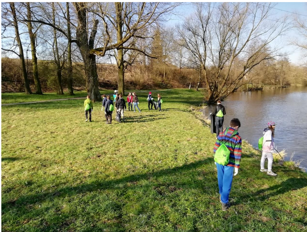
Žáci 8. ročníku během akce Čistá řeka Sázava

Environmentální výchova a ekologická výchova je přirozenou součástí života školy. Samozřejmostí je třídění odpadů, sběr léčivých bylin, pomerančové kůry a kaštanů. EMV patří k průřezovým tématům ŠVP, proto se objevuje ve všech vyučovacích předmětech. Žáci mají možnost v rámci volitelných předmětů vybrat si právě EMV. Naše škola je již několik let součástí projektu Chaloupky. V letošním školním roce se ekologického pobytu v Chaloupkách zúčastnila třída 7. B (3. 12. - 7. 12. 2018). Zúčastnili jsme se mezinárodního projektu „Víkend otevřených zahrad“ a uspořádali jsme rovněž sběrové akce. V rámci EMV se uskutečnily i další zajímavé projekty: