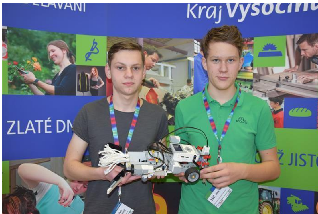
Vítězství v soutěži LEGO ROBOT