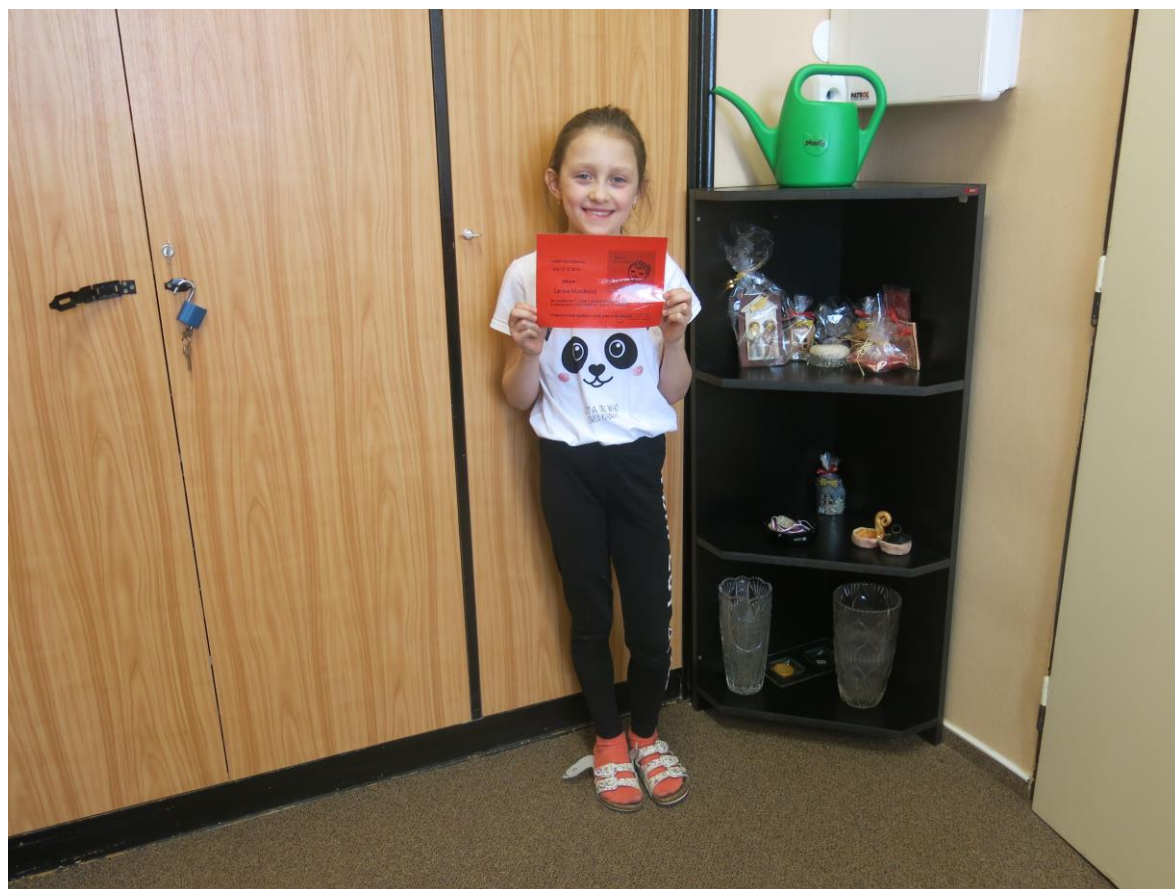
Nadějná recitátorka z I. stupně