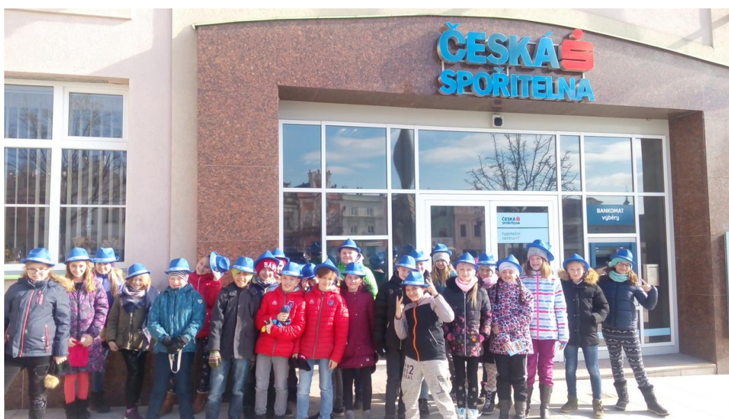
Žáci 5. ročníku zapojení do projektu „Abeceda peněz“