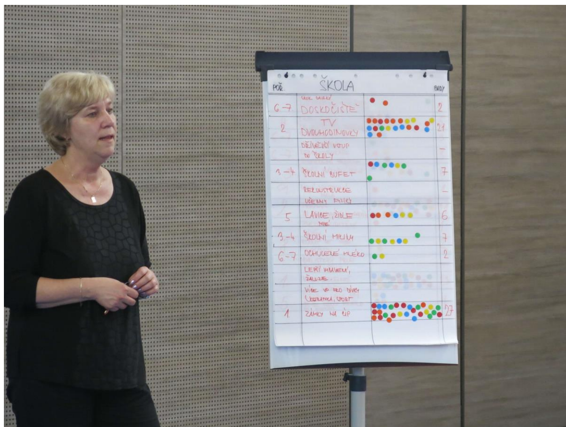
Školní fórum na ZŠ V Sadech – co bychom chtěli zlepšit v naší škole