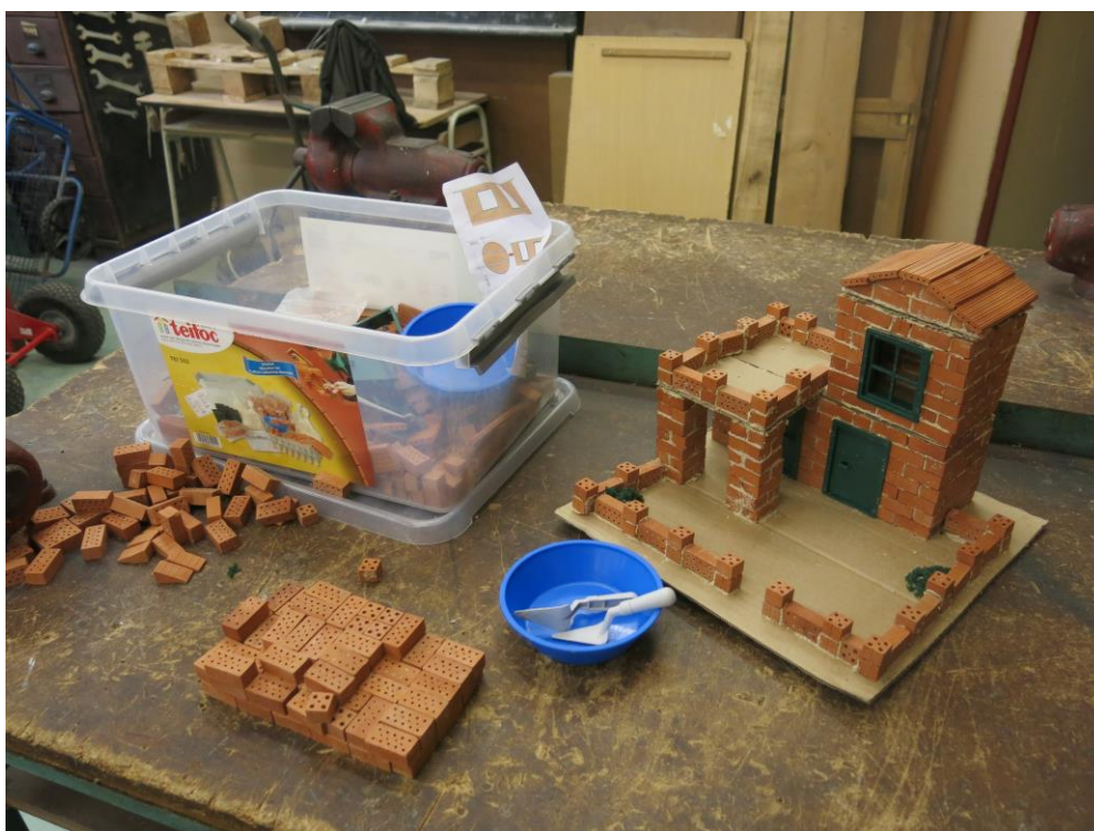
Práce se stavebnicí Teifoc