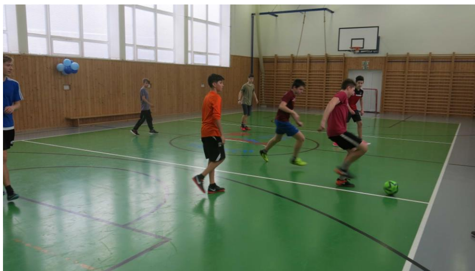
Předvánoční fotbalový turnaj