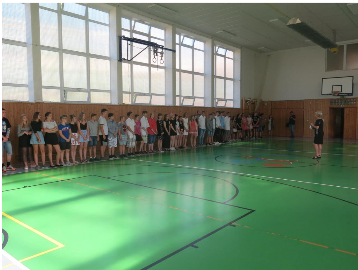
Motivační program žáků 9. ročníku – slavnostní vyhlášení výsledků

Na I. stupni proběhly ukázky miniházené a šermu .