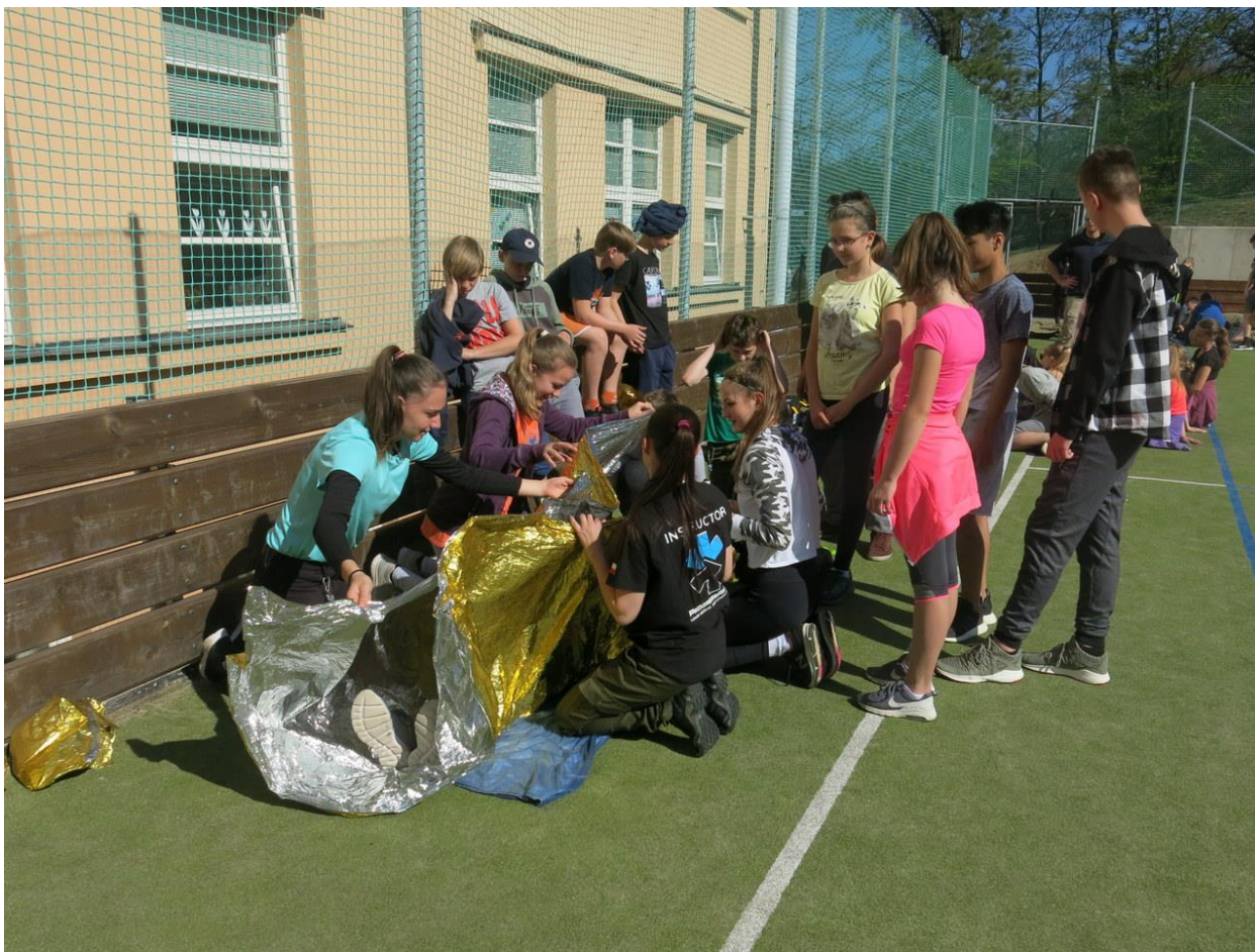
Kurz mimořádných situací