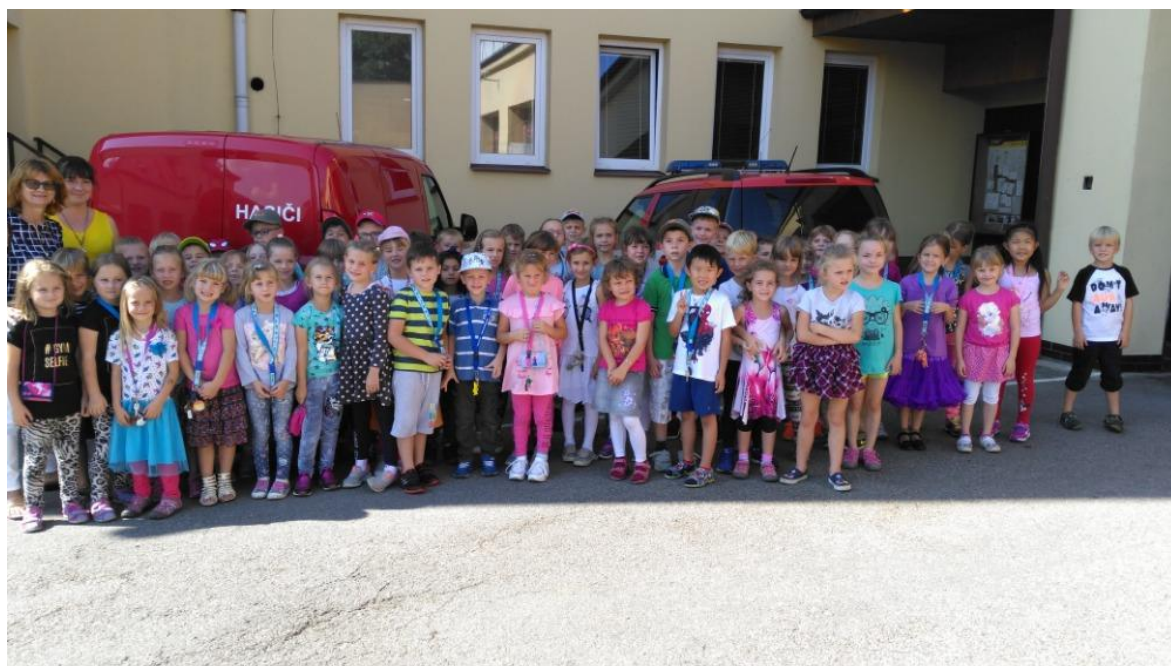
Školní družina na návštěvě u hasičů