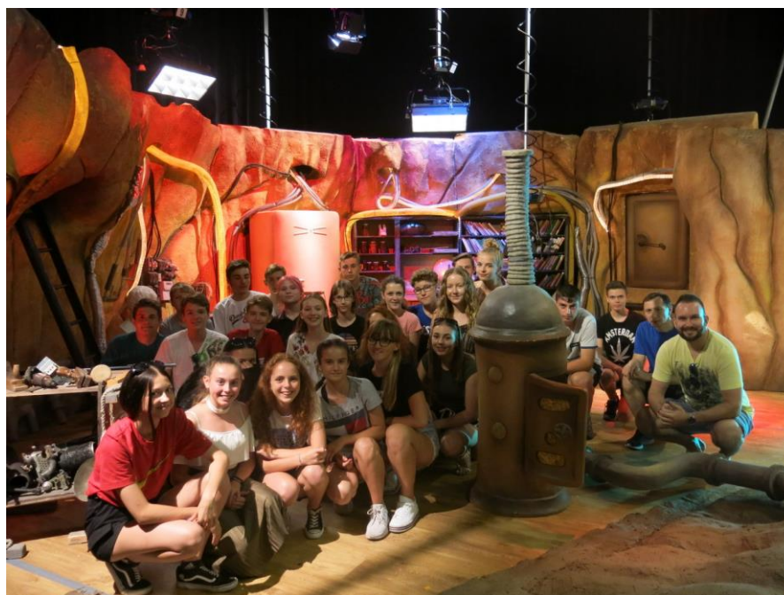
Projekt „Ještě nekončíme 2019“ – návštěva České televize