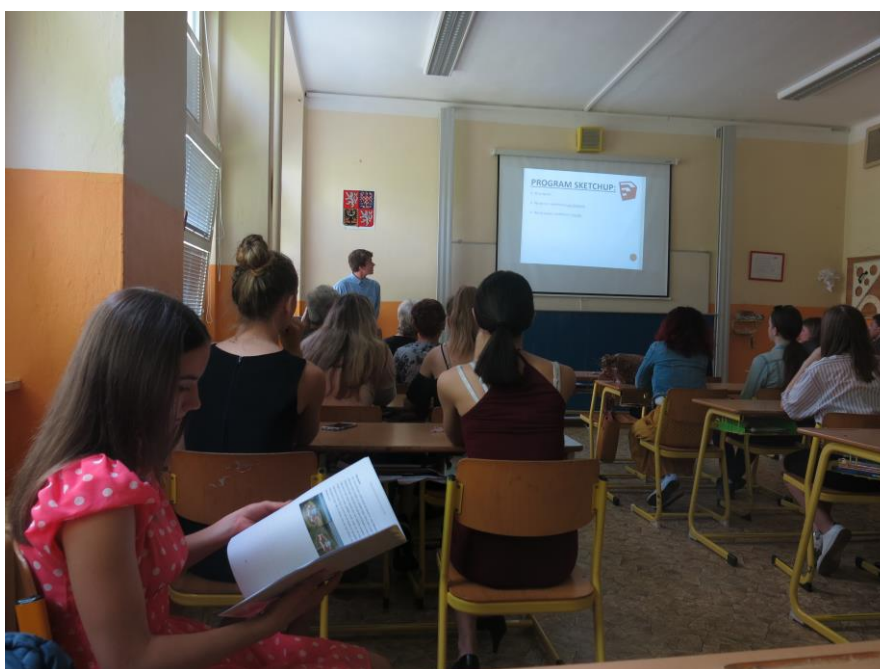
Slavnostní prezentace závěrečných prací žáků 9. ročníku