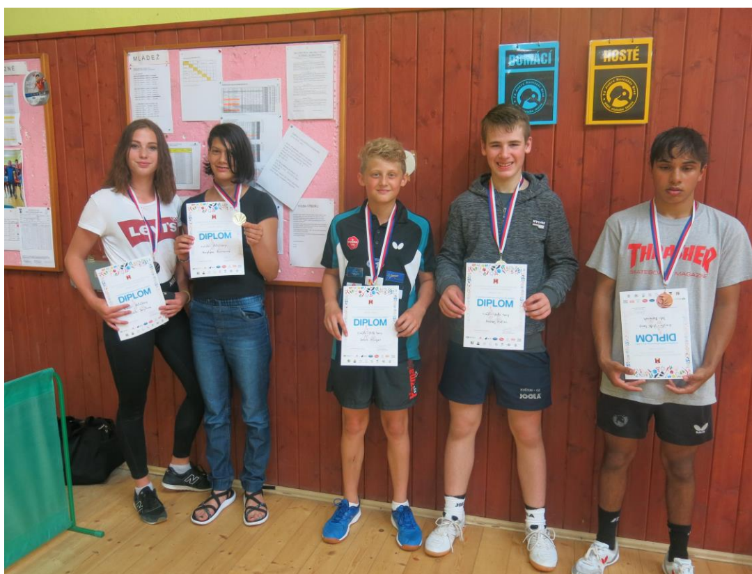
Havlíčkobrodské sportovní hry 2019 – zlatá medaile ze stolního tenisu