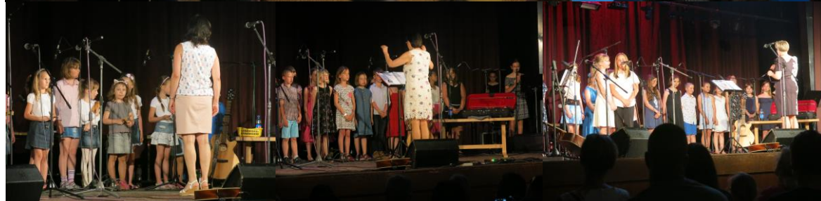
Z koncertů pěveckého sboru Oříšek