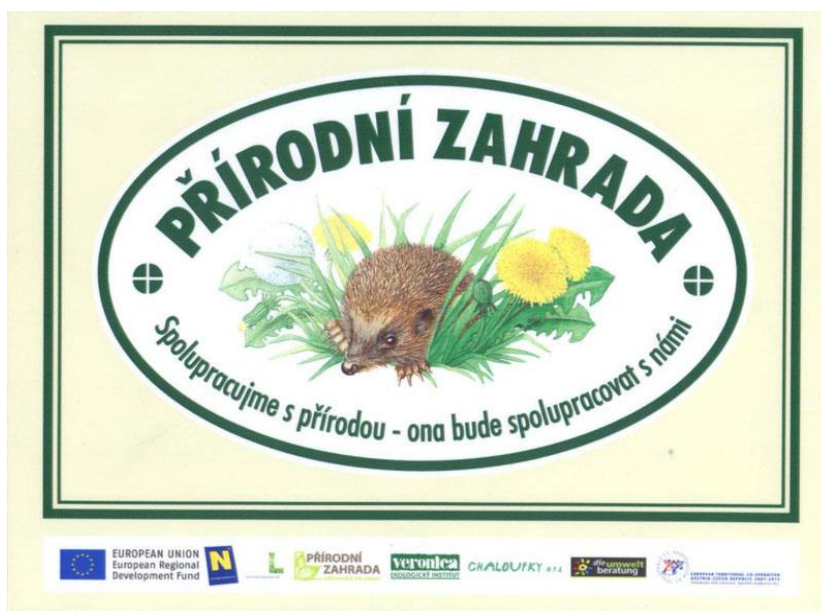
Školní zahrada při ZŠ V Sadech nese certifikát Přírodní zahrada

Naše školní zahrada má certifikát Přírodní zahrada - Spolupracujeme s přírodou - ona bude spolupracovat s námi.