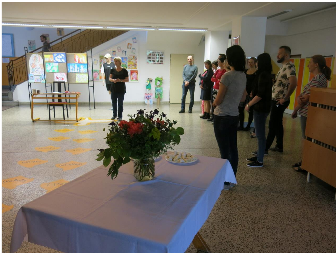
Pojďte s námi do školy 2019 – slavnostní zahájení