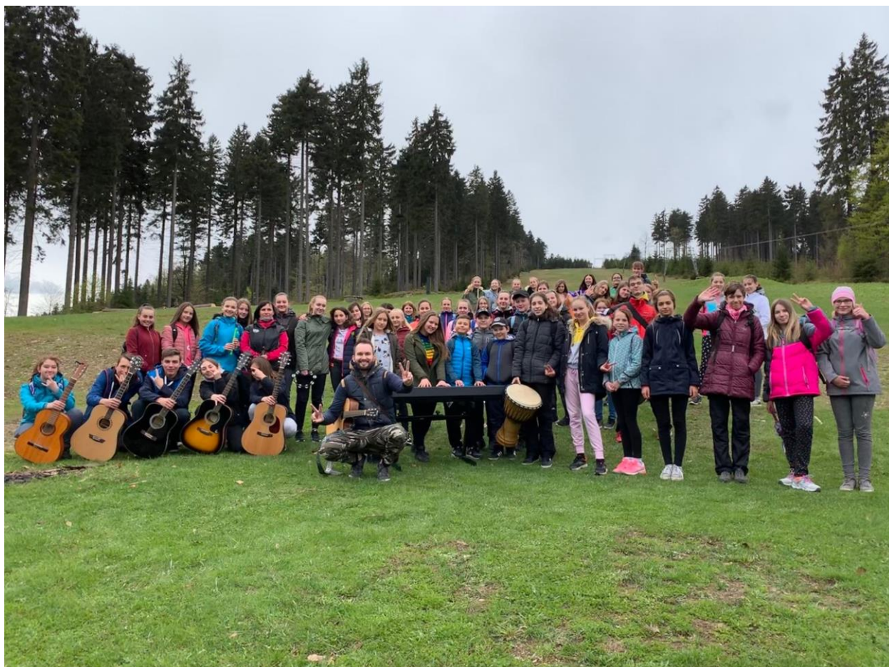
Oříšek na soustředění v Orlických horách

3. - 7. 12. 2018 Chaloupky – pobyt s tematikou environmentální výchovy – 7. B 12. – 15. 5. 2019 Orlické hory – chata Kačenka – sbor Oříšek – 6. – 9. ročník 3. – 7. 6. 2019 Sportovně ozdravný pobyt s výukou anglického jazyka – Chlum u Třeboně – 5. ročník